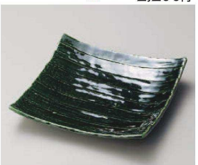
ホ187-239 そぎ織部正角8.0皿 22×22cm (磁) JPN 2,980円