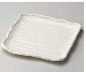
イ187-119 練色荒そぎ7.0角皿 22×21.5×2.3cm (磁) JPN 4,150円