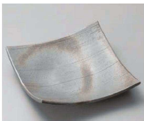
×187-029 黒銀彩そり7.3正角皿 21×21×5.5cm JPN 6,300円 ×187-039 黒銀彩そり6.3正角皿 19×19×4.5cm JPN 4,600円