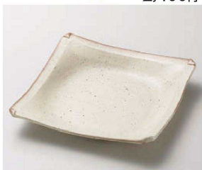
カ187-139 オルジェ折り紙大 21.5×21.5×3.5cm (磁) JPN 3,650円 カ187-149 オルジェ折り紙中 14×14×2.5cm (磁) JPN 1,650円