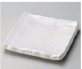
キ187-159 白マット荒彫角皿(大) 20.3×20.3×3.6cm (磁) JPN 3,520円 キ187-169 白マット荒彫角皿(小) 15.7×15.7×3.4cm (磁) JPN 2,200円