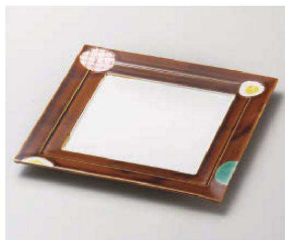
≡187-079 ア×釉段付正角皿 20.3×20.3×1.5cm (磁) JPN 4,350円