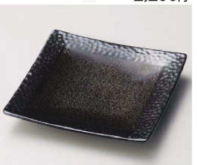
ホ187-249 茶色シヨコ正角7.0皿 21.5×21.5×2cm (磁) JPN 2,750円