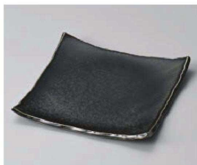
ア187-199 黒マットちぎり四方上21.5cm角皿 21.5×21.5×2.7cm (磁) JPN 3,450円 ア187-209 黒マットちぎり四方上15cm角皿 15×15×2cm (磁) JPN 1,350円