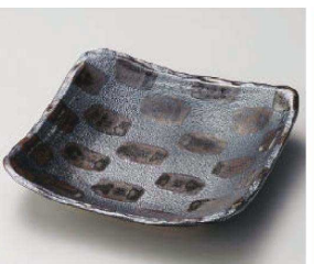
□187-069 黒市松7.0角鉢 20.3×20.5×4.2cm (磁) JPN 4,350円