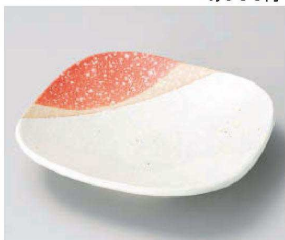
□187-089 なごみ正角7.5皿 20.1×20.1×4cm (磁) JPN 4,200円 □187-099 なごみ正角6.5皿 15.5×15.5×3.3cm (磁) JPN 2,400円