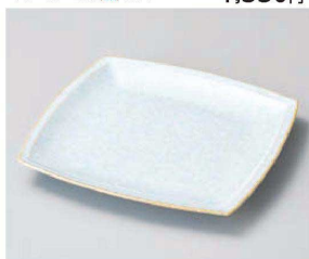
□187-259 ブルーTi結晶角皿(大) 22×22×2.4cm (磁) JPN 3,720円 □187-269 ブルーTi結晶角皿(中) 17.8×17.8×2.2cm (磁) JPN 2,760円 □187-279 ブルーTi結晶角皿(小) 12.8×12.8×1.7cm (磁) JPN 1,500円