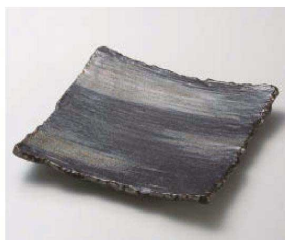
ネ187-019 加茂川2.3cm正角皿 23×23×3cm (磁) JPN 6,300円