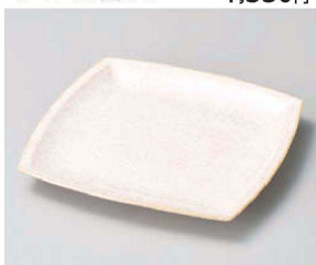
□187-289 オレンジTi結晶角皿(大) 22×22×2.4cm (磁) JPN 3,720円 □187-299 オレンジTi結晶角皿(中) 17.8×17.8×2.2cm (磁) JPN 2,760円 □187-309 オレンジTi結晶角皿(小) 12.8×12.8×1.7cm (磁) JPN 1,500円