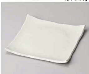
ア187-219 白マットちぎり四方上21.5cm角皿 21.5×21.5×2.7cm (磁) JPN 3,450円 ア187-229 白マットちぎり四方上15cm角皿 15×15×2cm (磁) JPN 1,350円