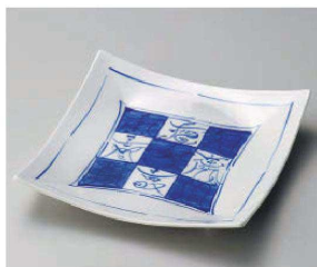
ト187-129 ダミ文字市松正角皿 21×20.7×3.5cm (磁) JPN 3,900円