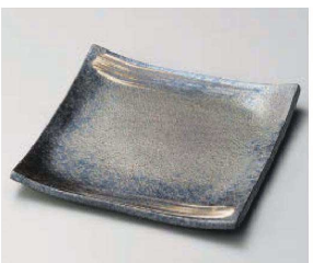
×187-049 黒窯変刷毛目7.0角皿 21×21×2cm (陶) JPN 4,500円 ×187-059 黒窯変刷毛目5.0角皿 15×15×1.5cm (陶) JPN 2,500円