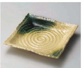
ユ187-319 黄瀬戸織部吹手造り正角皿 21×21×3.5cm (陶) JPN 2,600円