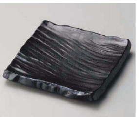
キ187-179 黒備前荒彫角皿(大) 20.3×20.3×3.6cm (磁) JPN 3,520円 キ187-189 黒備前荒彫角皿(小) 15.7×15.7×3.4cm (磁) JPN 2,200円