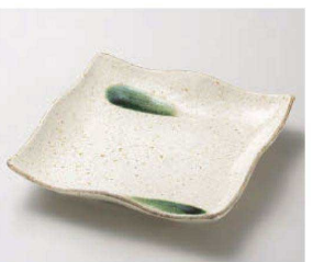
≡187-329 土化粧 正角9.0皿 23.3×23.3×4.3cm (磁) JPN 2,650円 ≡187-339 土化粧 正角7.0皿 18×18×3.5cm (磁) JPN 1,350円