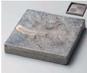
×188-019 黒窯変クシ目6.8角皿(両面使用可) 20.5×20.5×3cm(陶) JPN 7,000円