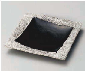
オ188-119 黒織部四辺筋皿 φ18×2cm(磁) JPN 4,150円