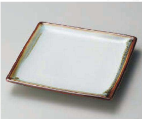
オ188-239 流水瀉部まな板正角楕物 17.5×4cm(陶) JPN 2,700円