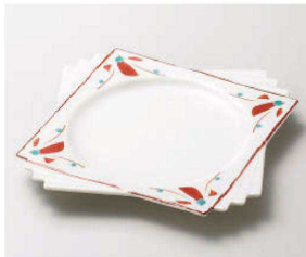
ㄥ188-099 淡雪赤絵 千代折角大皿 20.5×20.5×2.5cm(磁) JPN 4,200円