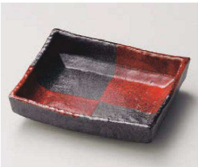
ミ188-129 暁市松長角鉢 19×15.5×5cm(磁) JPN 4,550円