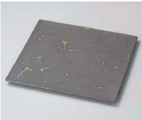
オ188-079 黒釉金飛ばし荒彫24.5cmプレート 24.5×24.5×1cm(陶) JPN 5,000円