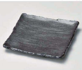
オ188-249 白天目流し正角天ぶら皿 19×19cm(磁) JPN 2,450円