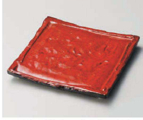
ツ188-159 紅黒炭正角皿(小) 20.5×20.3×2.5cm(陶) JPN 3,700円