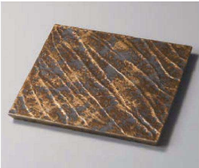
ツ188-039 金タタキソギ彫正角皿(大) 24×24×1.5cm(磁) JPN 6,600円