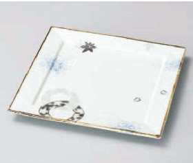
オ188-049 和み輪つなぎブラックリム付正角皿 23.5×23.5×2cm(磁) JPN 6,550円