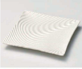
キ188-179 粉引釉 風紋正角皿(大) 19.8×19.8×2.5cm(磁) JPN 2,810円