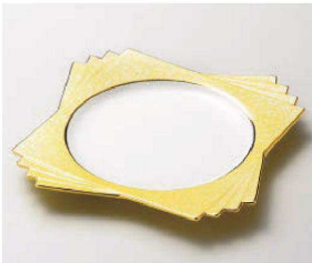
ミ188-069 黄釉 四ツ重ね 前菜皿 20.5×20.5×2.5cm(磁) JPN 5,200円