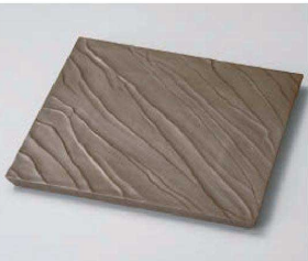
オ188-089 炭化土荒彫23.5cmプレート 23.5×23×1.8cm(陶) JPN 5,000円