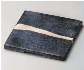
×188-059 黒窯変一文字6.3角皿 19×19×1.5cm(陶) JPN 5,500円