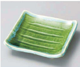
キ188-229 砂丘 風紋正角皿(小) 16.6×16.6×2cm(磁) JPN 1,820円