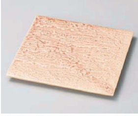
ミ188-169 ローズマット石肌20cm正角皿 20.5×20.5×1.4cm(磁) JPN 3,500円