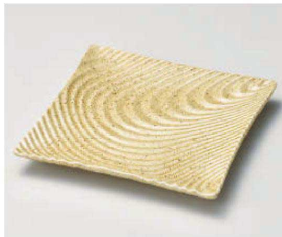
キ188-219 砂丘 風紋正角皿(大) 19.8×19.8×2.5cm(磁) JPN 2,810円