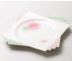
ㄥ188-139 淡雪二色吹 千代折角大皿 20.5×20.5×2.5cm(磁) JPN 3,780円