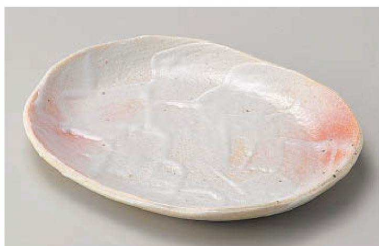
オ195-089 桜志野タタラ皿 21.1×17.2×2.3cm (磁) JPN