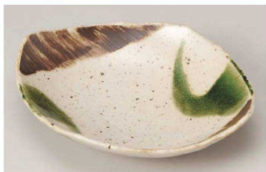
ヨ195-079 能登 5.5平鉢 22×18.2×5cm (磁) JPN