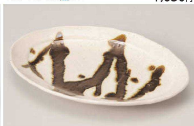
ア195-149 金彩オーバル24皿 23.8×16×3.2cm (陶) JPN