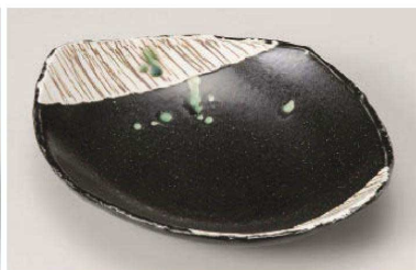
ヨ195-069 黒織部 5.5平鉢 22×18.2×5cm (磁) JPN