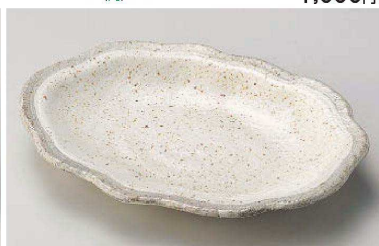
ミ195-189 白唐津雲型皿 22×17×3.2cm (磁) JPN