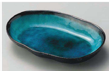
オ195-099 ヒスイ天目小判皿(大) 20×14×3.5cm (磁) JPN