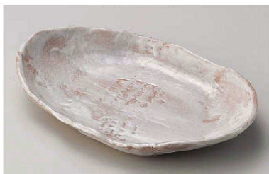
ロ195-029 手造り風志野楕円多用皿 24.8×16.4×4cm (陶) JPN