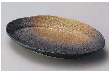
ヤ195-129 月光黒備前23cm長丸皿 23×15.4×3cm (磁) JPN