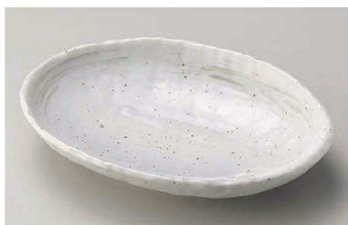
ネ195-119 錆ウズ22cm楕円皿 22×16.5×4cm (磁) JPN