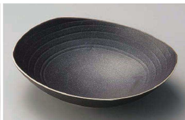
ア195-039 黒釉だ円盛皿 22.8×19.3×5.6cm (磁) JPN