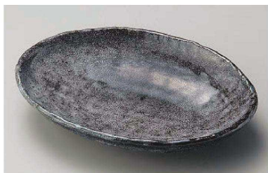
カ195-019 霰石小判皿 22.2×16.3×3.8cm (磁) JPN