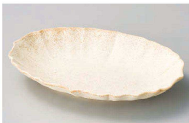
カ195-059 ロータス23オーバル 白 23.5×17.8×3.3cm (磁) JPN