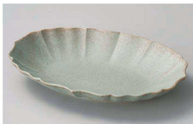
カ195-049 ロータス23オーバル グレー 23.5×17.8×3.3cm (磁) JPN