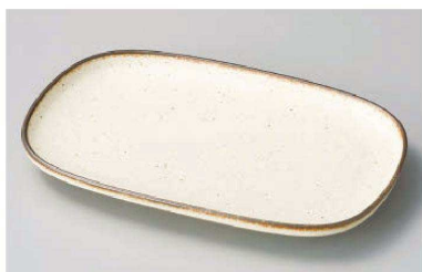
ホ195-169 クレタ 切立リム変形だえん皿 24.3×16.2×2.3cm (磁) JPN