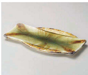
ミ201-029 灰釉耳付長大皿 30.8×17.3×1.5cm (磁) JPN 5,750円