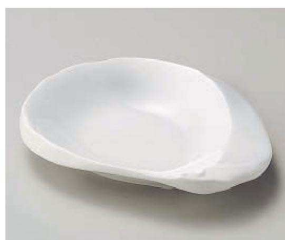
カ201-059 強化白釉ちぎり6.5寸皿 20×16.5×3.5cm (磁) JPN 3,350円