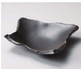
ツ201-069 荒黒ちぎり8.0盛皿 24×17.5×5.5cm (磁) JPN 3,400円