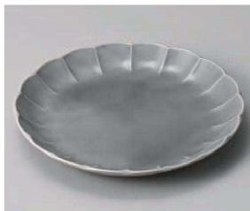
カ201-249 フィオレグレー花型21.5cm皿 φ21.5×2.8cm (磁) JPN 1,000円