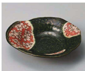
ロ201-119 織部舞桜三つ足和皿 18×17×3.8cm (陶) JPN 2,760円