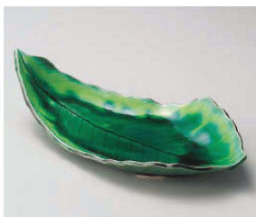
ト201-039 緑釉木の葉尺二皿 35×18×8cm (磁) JPN 6,000円