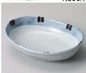
ホ201-139 はなやぎ7.0小判鉢 20.5×15×4.7cm (磁) JPN 2,700円