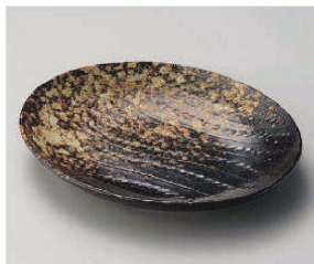
ミ201-199 黒備前縄目楕円皿 24×19.5×3.5cm (磁) JPN 1,150円