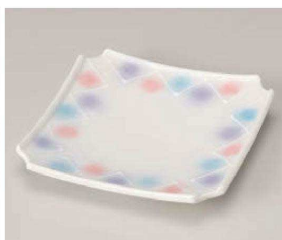
ミ201-109 淡雪三色吹 正角前菜皿 18.5×18.5×3.2cm (磁) JPN 3,150円