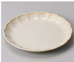
カ201-229 フィオレクリーム花型21.5cm皿 φ21.5×2.8cm (磁) JPN 1,000円