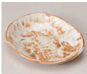
イ201-189 南蛮志野楕円6.0皿 18.5×15×3.3cm (磁) JPN 1,250円