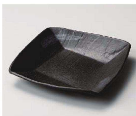
ミ201-149 黒銀河スクエア7.5皿 19×18.7×3cm (磁) JPN 2,300円