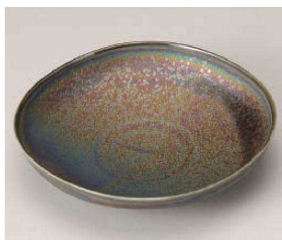
ア201-049 窯彩なで角20cm浅鉢 20.2×20.2×5.1cm (磁) JPN 3,400円