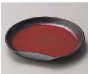
ロ201-089 めくもり半月7.0皿 21×20cm (磁) JPN 3,200円