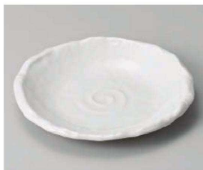
ミ201-159 アイランドうず形6.0皿 19×18.5×3.8cm (磁) JPN 2,250円