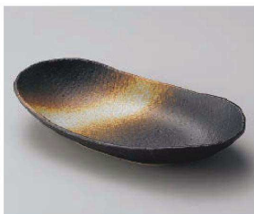
ト201-179 黒吹まゆ型 25.3×13.8×4.5cm (磁) JPN 1,380円