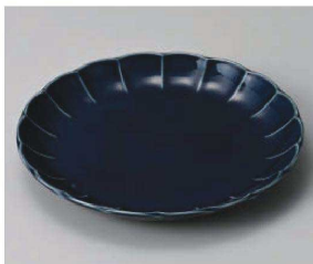
カ201-209 フィオレネイビー花型21.5cm皿 φ21.5×2.8cm (磁) JPN 1,000円