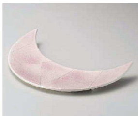
ミ201-019 銀彩二色吹き三日月前菜 32.5×12×2.7cm (磁) JPN 6,450円