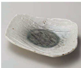
ヨ201-169 湖畔前菜皿 21×17×4cm (磁) JPN 1,600円