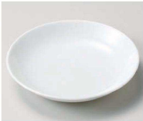
ホ209-089 かるーん(軽量食器)6.0皿 φ20×3.5cm (磁) JPN 1,200円