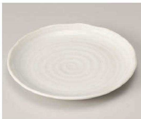
ハ209-209 粉引|袖7.0皿 φ21×2.5cm (磁) JPN 950円