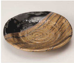
ト209-029 金塗り分 6.0皿 φ19.5×3.3cm (陶) JPN 2,250円