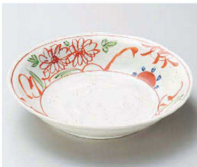
ヤ209-169 粉引|袖古代赤絵7.0深皿 φ21.7×4.7cm (磁) JPN 1,400円