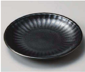
イ209-049 鉄結晶削ぎ6.0皿 φ21.2×3cm (磁) JPN 1,650円