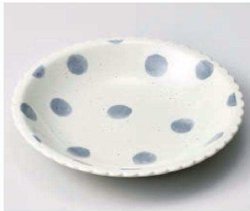
キ209-079 あわあわ21cm深皿 φ21×3.6cm (磁) JPN 1,430円