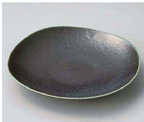
ネ209-149 窯変ブラック20cm四方皿 19.6×19.6×3.2cm (磁) JPN 1,100円