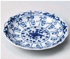
ト209-129 福福花割6.0皿 φ19×3cm (磁) JPN 1,200円