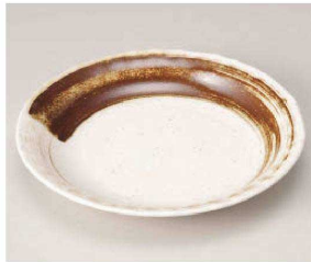
ホ209-059 サビ刷毛7.0皿 φ21.4×3cm (磁) JPN 1,450円