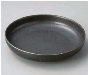
ネ209-109 窯変ブラック20cm切立皿 φ20.2×4cm (磁) JPN 1,300円