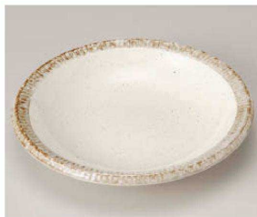
ネ209-179 測鑄粉引測十草 8吋スーブ φ21.2×4.3cm (磁) JPN 1,000円 ネ209-189 測鑄粉引測十草 5.0鉢 φ17.3×4cm (磁) JPN 900円