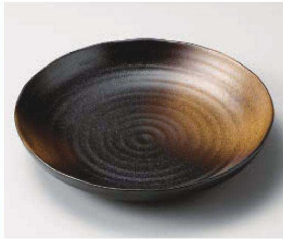
ホ209-039 金茶吹新7.0深皿 φ22.5×4cm (磁) JPN 1,950円