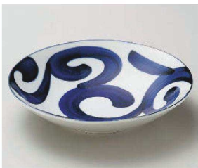
タ209-219 鳴門唐草平型7.0深皿 φ21.5×4.9cm (磁) JPN 800円