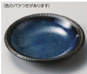
ホ209-199 深海マリン21cm深皿 φ21.2×4.5cm (磁) JPN 950円