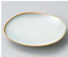
ネ209-139 窯変うのふ20cm四方皿 19.6×19.6×3.2cm (磁) JPN 1,100円