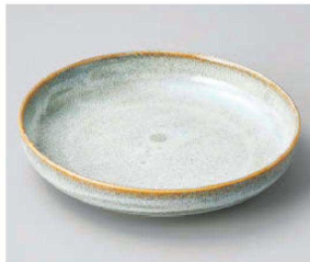
ネ209-099 窯変うのふ20cm切立皿 φ20.2×4cm (磁) JPN 1,300円