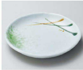
ホ209-019 美濃路玉淵6.5皿 φ20.5×3cm (磁) JPN 2,700円