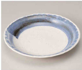
ホ209-069 ゴス刷毛7.0皿 φ21.4×3cm (磁) JPN 1,450円