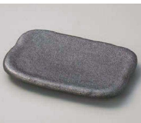
ヨ213-039 ブラックパールパレット16cm取皿 16×11×1.8cm(磁)JPN 2,000円