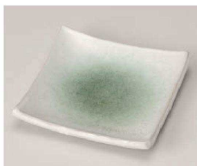
ロ213-059 新緑正角銘々皿 12.5cm(磁)JPN 1,850円