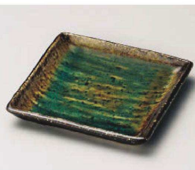
ア213-169 深海12cm四角皿 12×12×1.7cm(陶)JPN 950円