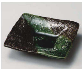
タ213-069 天の川華前菜皿 16×15×3.5cm(陶)JPN 1,800円