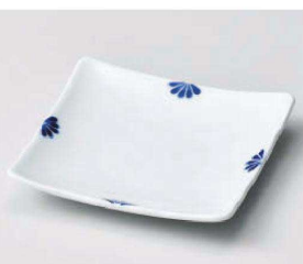
ロ213-119 小花(青)正角銘々皿 12×12×1.8cm(磁)JPN 1,400円