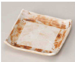
ロ213-149 志野 4寸正角皿 12.8×12.8×2.5cm(磁)JPN 1,120円