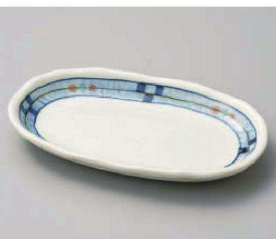
ミ213-159 キューヴ小判6.5皿 19.5×12.2×2.2cm(磁)JPN 1,650円