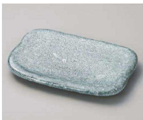
ヨ213-029 初霜パレット16cm取皿 16×11×1.8cm(磁)JPN 2,500円