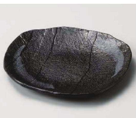
ミ213-079 黒銀河フルーツ皿 17×15.5×2cm(磁)JPN 1,700円