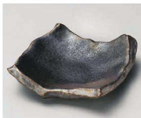
カ213-019 銀サビ黒ちぎり角皿(小) φ13×13×3.6cm(磁)JPN 2,950円