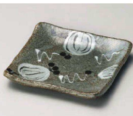
ロ213-049 山帰来正角銘々皿 13.5×13.5×2.5cm(陶)JPN 1,990円