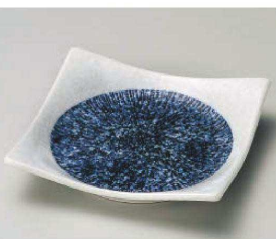
ホ213-199 しほり藍十草正角4.5皿 13.5×13.5cm(磁)JPN 780円