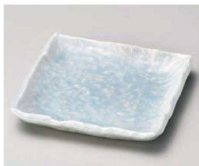
ロ213-139 青白釉正角銘々皿 12.3×12.3×2.1cm(磁)JPN 1,120円