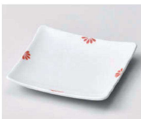
ロ213-109 小花(赤)正角銘々皿 12×12×1.8cm(磁)JPN 1,400円