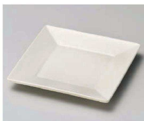
イ213-099 緑色スクエア4.5角皿 13.5×13.5×1.5cm(磁)JPN 1,450円