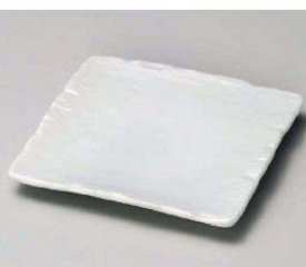
イ213-129 弥生千筋白正角皿 12×12×1.3cm(磁)JPN 1,200円