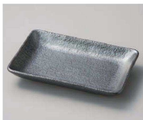
ロ213-179 ゆず黒長角のり皿 14×9.5×2cm(磁)JPN 890円