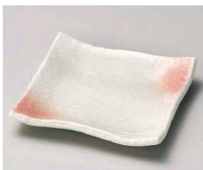
イ213-189 桃山ふぶき正角皿 10.5×10.5×2cm(磁)JPN 800円