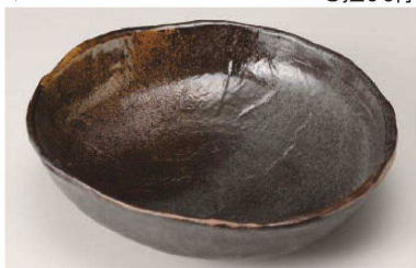
ス233-209 琥珀10号盛鉢 φ30×8.5cm (陶) (萬古焼) JPN 8,300円 ス233-219 琥珀8号盛鉢 φ24×7cm (陶) (萬古焼) JPN 4,000円