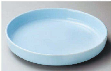
ス233-079 青地ドラ鉢 φ30.5×5.8cm (陶) (萬古焼) JPN 5,000円