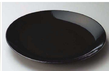
ス233-059 黒釉12号丸皿 φ37×4.5cm (陶) (萬古焼) JPN 5,600円 ス233-069 黒釉10号丸皿 φ32×3.5cm (陶) (萬古焼) JPN 4,100円