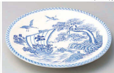
ス233-119 宝船12号丸皿 φ37×4cm (陶) (萬古焼) JPN 5,700円 ス233-129 宝船10号丸皿 φ32×3cm (陶) (萬古焼) JPN 3,600円