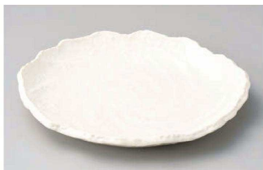
ス233-019 うず潮10号丸皿 30.5×26.5×3.8cm (陶) (萬古焼) JPN 4,300円 ス233-029 うず潮8号丸皿 24.5×21.5×3.5cm (陶) (萬古焼) JPN 2,900円