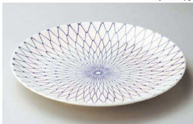
ス233-089 網目13号丸皿 φ42×5.5cm (陶) (萬古焼) JPN 9,300円 ス233-099 網目12号丸皿 φ38×4cm (陶) (萬古焼) JPN 5,700円 ス233-109 網目10号丸皿 φ32×3.5cm (陶) (萬古焼) JPN 3,600円