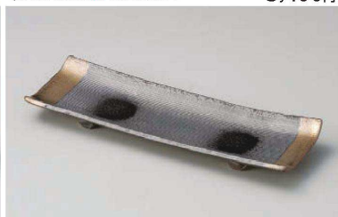
ス233-269 黒吹金彩9号付出皿 29×9.7×3cm (陶) (萬古焼) JPN (手造り) 3,600円