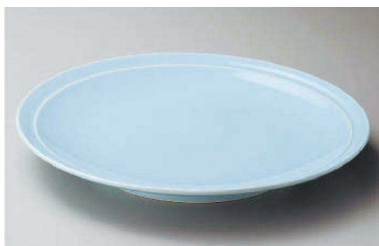
ス233-039 青地12号高台皿 φ37.5×5cm (陶) (萬古焼) JPN 5,700円 ス233-049 青地11号高台皿 φ34.5×5cm (陶) (萬古焼) JPN 5,100円