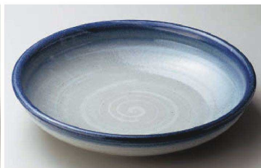
ス233-179 清流10号盛鉢 φ29.5×6.5cm (陶) (萬古焼) JPN 7,200円