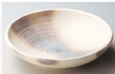
ス233-229 萩風10号めん鉢 φ30×8cm (陶) (萬古焼) JPN 6,000円 ス233-239 萩風8号めん鉢 φ24.5×6.5cm (陶) (萬古焼) JPN 3,400円