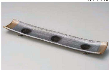
ス233-259 黒吹金彩14号細前菜皿 44.5×9×3cm (陶) (萬古焼) JPN (手造り) 5,000円