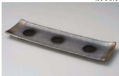
ス233-249 黒吹金彩14号長盛皿 45.5×13.3×3cm (陶) (萬古焼) JPN (手造り) 7,500円