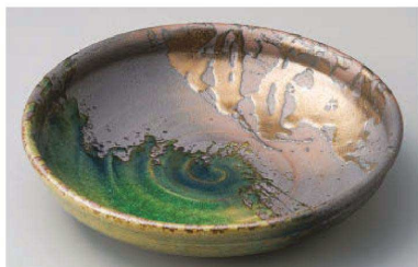
ス233-139 伊賀金彩10号盛鉢 φ29.5×5cm (陶) (萬古焼) JPN 7,200円 ス233-149 伊賀金彩8号盛鉢 φ21×4.5cm (陶) (萬古焼) JPN 3,200円