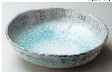
ス233-189 青釉10号盛鉢 φ30×8.5cm (陶) (萬古焼) JPN 8,300円 ス233-199 青釉8号盛鉢 φ24×7cm (陶) (萬古焼) JPN 4,000円