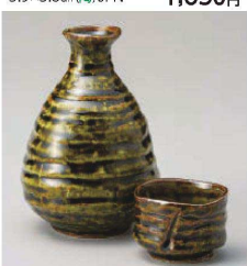
ヨ273-399 深緑手びねり2合徳利 φ8×12.2cm(400cc) (陶) JPN 1,600円 ヨ273-409 深緑手びねり1合徳利 φ6.5×11cm(250cc) (陶) JPN 1,300円 ヨ273-419 深緑手びねりぐい呑 φ5.7×4cm(75cc) (陶) JPN 750円