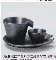
カ273-369 銀黒片口冷酒器 9.3×8×7cm(120cc) (陶)JPN 1,980円 カ273-379 銀黒いっしゅいませの皿 φ15.5×2.3cm (陶) JPN 1,650円 カ273-389 銀黒手巾盃 φ5.7×3.4cm(30cc) (陶) JPN 850円