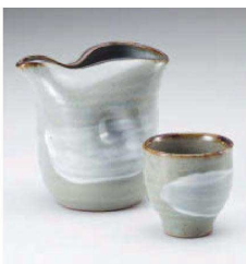
ネ273-039 刷毛目冷酒器 11×7×10.3cm(380cc) (陶)JPN 3,800円 ネ273-049 刷毛目カップ φ5.9×6.1cm (陶) JPN 1,800円