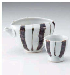
ト273-019 錆十草手押冷酒器 14×9.7×8.2cm(350cc) (陶)JPN 3,700円 ト273-029 錆十草高台盃 φ6×5.9cm (陶) JPN 1,700円