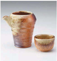
メ273-199 古信楽冷酒器 φ9×9.8cm(250cc) (陶)JPN 2,400円 メ273-209 古信楽ぐい呑 φ6×4.7cm(60cc) (陶) JPN 750円