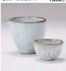
タ273-349 黒陶粉引片口冷酒器 10.8×9.2×8.6cm(300cc) (陶)JPN 1,600円 タ273-359 黒陶粉引丸ぐい呑 φ7.3×4.5cm(100cc) (陶)JPN 700円