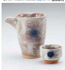
ホ273-329 ポカシ片口冷酒器 11×8×10.5cm(240cc) (陶)JPN 1,700円 ホ273-339 ポカシ盃 φ6×4cm (陶) JPN 480円