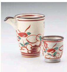
ホ273-059 粉引花鳥酒器 11×8.5×11cm(230cc) (陶)JPN 3,100円 ホ273-069 粉引花鳥ぐいのみ φ5.8×6.3cm (陶)JPN 1,750円