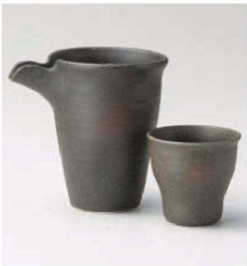
ア273-179 備前風冷酒器 11.5×8.6×11.2cm(320cc) (陶)JPN 3,100円 ア273-189 備前風盃 φ6.7×6.3cm (陶) JPN 1,150円