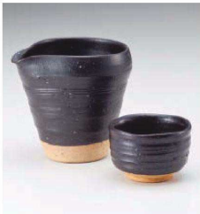
ミ273-139 黒織部冷酒器 11×10×10.5cm(420cc) (陶)JPN 2,850円 ミ273-149 黒織部ぐい呑 φ7.2×4.7cm (陶) JPN 1,600円