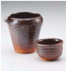
ミ273-159 備前灰吹き冷酒器 11×10×10.5cm(420cc) (陶)JPN 2,850円 ミ273-169 備前灰吹きぐい呑 φ7.2×4.7cm (陶) JPN 1,600円