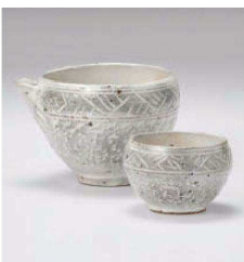
ミ273-079 粉引とびかな影冷酒器 12.5×10.6×8.2cm(350cc) (陶)JPN 2,900円 ミ273-089 粉引とびかな影ぐい呑 φ7.8×5cm(120cc) (陶)JPN 1,750円