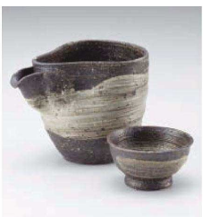
メ273-099 灰刷毛目冷酒器 12×9×10cm(290cc) (陶)JPN 3,800円 メ273-109 灰刷毛目ぐい呑 φ6.7×3.5cm(50cc) (陶)JPN 1,400円