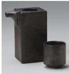
ア273-119 いぶし黒角冷酒器 8.8×6×11.5cm(280cc) (陶)JPN 2,500円 ア273-129 いぶし黒切立盃 φ5×5.3cm(45cc) (陶)JPN 930円