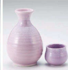
ア275-249 吹桃山丸2号徳利 φ8×12.4cm(300cc) (桃) JPN 1,750円 ア275-259 吹桃山丸1号徳利 φ6.8×10.7cm(150cc) (桃) JPN 1,000円 ア275-269 吹桃山壺 5.2×4.5cm (桃) JPN 550円