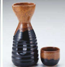
ア275-549 金流し1.5号徳利 φ7×15.4cm(275cc) (黒) JPN 1,350円 ア275-559 金流し8号徳利 φ5.9×12.7cm(130cc) (黒) JPN 850円 ア275-569 金流し壺 φ5×4.2cm (黒) JPN 370円