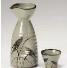
ミ275-369 益子水筒2号徳利 7.6×11.6cm(260cc) (青) JPN 2,450円 ミ275-379 益子水筒1号徳利 7.8×11.6cm(240cc) (青) JPN 2,350円 ミ275-389 益子水筒1号徳利 6×11.3cm(130cc) (青) JPN 1,250円 ミ275-399 益子水筒ぐい呑 5.4×4.4cm (青) JPN 720円