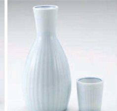
ト275-279 青白磁1.5号徳利 280cc (藍) JPN 2,400円 ト275-289 青白磁8号徳利 130cc (藍) JPN 1,450円 ト275-299 青白磁壺 φ4.2×5cm (藍) JPN 720円