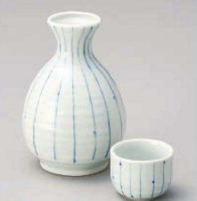
ヨ275-339 十草ホタル徳利(大) 9×13cm(300cc) (青) JPN 1,550円 ヨ275-349 十草ホタル徳利(小) 7×11cm(180cc) (青) JPN 800円 ヨ275-359 十草ホタル壺 φ5.4×4cm(50cc) (青) JPN 380円