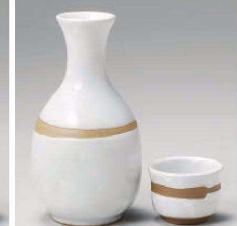
ロ275-439 茶筋徳利(大) 280cc (黒) JPN 2,040円 ロ275-449 茶筋徳利(小) 150cc (黒) JPN 1,740円 ロ275-459 茶筋ぐい呑 φ5×3.5cm (黒) JPN 810円