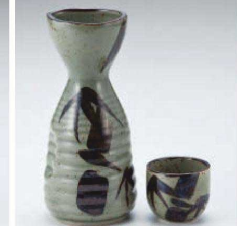
ア275-579 益子竹1.5号徳利 φ7×15.4cm(275cc) (黒) JPN 1,350円 ア275-589 益子竹8号徳利 φ5.9×12.7cm(130cc) (黒) JPN 850円 ア275-599 益子竹壺 φ5×4.2cm (黒) JPN 370円