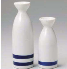
チ275-659 蛇ノ目本二号徳利 4.5×17.5cm(250cc) (藍) JPN 1,250円 チ275-669 蛇ノ目本一号徳利 4.5×13.2cm(150cc) (藍) JPN 1,000円