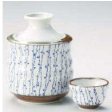
ネ275-019 古染つた 酒罎器(大) φ12×15.7cm(330cc) (藍) JPN 6,600円 ネ275-029 古染つた 酒罎器(小) φ10×13.5cm(180cc) (藍) JPN 4,320円 ネ275-039 古染つた 壺(大) φ7×4.5cm (藍) JPN 1,300円 ネ275-049 古染つた 壺(小) φ6×4.2cm (藍) JPN 1,200円