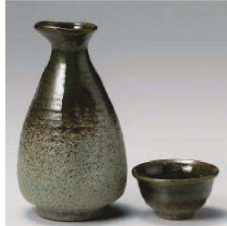
ユ275-159 若草織部 徳利1.5号 φ7.7×14.2cm(310cc) (黒) JPN 2,350円 ユ275-169 若草織部 徳利0.8号 φ6×12cm(180cc) (黒) JPN 1,950円 ユ275-179 若草織部 ぐい呑 φ6.4×3.5cm (黒) JPN 1,100円