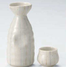
ホ275-489 唐津十草徳利(大) φ6.8×15.4cm(310cc) (黒) JPN 1,450円 ホ275-499 唐津十草徳利(小) φ5.8×12.6cm(180cc) (黒) JPN 850円 ホ275-509 唐津十草壺 φ5.4×4.5cm(60cc) (黒) JPN 450円