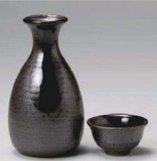
ユ275-189 黒釉織部吹き 二号徳利 φ8×14.2cm(320cc) (黒) JPN 2,350円 ユ275-199 黒釉織部吹き 一号徳利 φ7×12cm(185cc) (黒) JPN 1,950円 ユ275-209 黒釉織部吹き ぐい呑 φ6.4×3.5cm (黒) JPN 850円