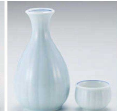
ト275-129 青白菊割徳利(大) 290cc (藍) JPN 2,800円 ト275-139 青白菊割徳利(小) 150cc (藍) JPN 1,750円 ト275-149 青白菊割壺 φ5×3.2cm (藍) JPN 1,100円