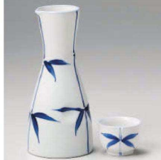
ト275-609 一珍笹二合徳利 φ7.7×16.8cm(300cc) (藍) JPN 3,000円 ト275-619 一珍笹一合徳利 φ6.3×14cm(150cc) (藍) JPN 2,100円 ト275-629 一珍笹 壺 φ10.3×3.8cm(50cc) (藍) JPN 1,100円