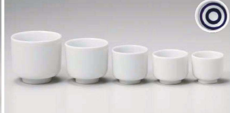
チ275-679 蛇ノ目壺8号壺 7×6.6cm(140cc) (藍) JPN 1,000円 チ275-689 蛇ノ目壺5号壺 6×5.6cm(100cc) (藍) JPN 580円 チ275-699 蛇ノ目壺3号壺 5.2×5cm(65cc) (藍) JPN 380円 チ275-709 蛇ノ目壺2.5号壺 4.9×4.3cm(50cc) (藍) JPN 350円 チ275-719 蛇ノ目壺2号壺 4.2×3.8cm(38cc) (藍) JPN 350円