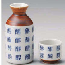
ト275-469 酉(ト)偏 徳利 φ6×12.2cm(200cc) (藍) JPN 1,900円 ト275-479 酉偏 壺 φ5×4.3cm(50cc) (藍) JPN 700円