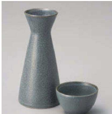
カ275-089 アッシュ1号徳利 φ7×14.5cm(230cc) (黒) JPN 3,800円 カ275-099 アッシュちび壺大 φ6.5×4.4cm (黒) JPN 1,200円