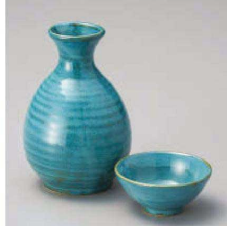
ヨ275-309 ヒスイ徳利(大) 9×13cm(300cc) (青) JPN 1,550円 ヨ275-319 ヒスイ徳利(小) 7×11cm(180cc) (青) JPN 800円 ヨ275-329 ヒスイ壺 φ7.2×3.5cm(50cc) (青) JPN 380円