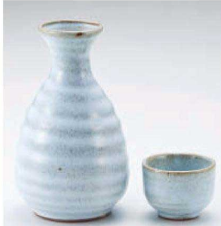
ト275-219 灰釉青磁徳利(大) 260cc (青) JPN 2,100円 ト275-229 灰釉青磁徳利(小) 150cc (青) JPN 1,650円 ト275-239 灰釉青磁壺 φ5.2×3.8cm (青) JPN 750円