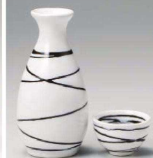
ユ275-409 うず湖二号徳利 約280cc (黒) JPN 2,350円 ユ275-419 うず湖一号徳利 約170cc (黒) JPN 1,480円 ユ275-429 うず湖ぐい呑 φ6×3.5cm (黒) JPN 720円