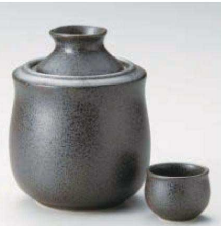
ト275-059 黒結晶酒ポット(大) φ12.5×15.2cm(310cc) (黒) JPN 5,500円 ト275-069 黒結晶酒ポット(小) φ10×12.2cm(140cc) (黒) JPN 3,300円 ト275-079 黒結晶グイ呑 φ5.5×4.4cm (黒) JPN 700円