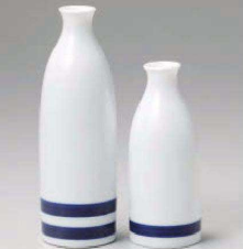
カ275-639 白磁二本線1.5号徳利 φ5.6×17.2cm(280cc) (藍) JPN 2,100円 カ275-649 白磁一本線1号徳利 φ5.2×13.2cm(180cc) (藍) JPN 1,380円