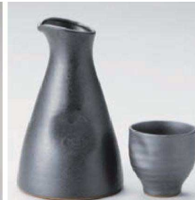
ネ275-109 いぶし黒釉大徳利 φ9.5×15.5cm(420cc) (黒) JPN 2,800円 ネ275-119 いぶし黒釉ぐい呑み φ6×6cm(100cc) (黒) JPN 1,500円