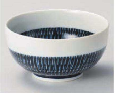
イ323-269 藍色トピカノお好み丼 大 φ16×8.4cm(磁) JPN 1,250円 イ323-279 藍色トピカノお好み丼 小 φ13.2×7.4cm(磁) JPN 950円