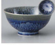
ア323-399 すぶらっしゅゆ和み16cm丼 φ16×8cm(磁) JPN 1,150円