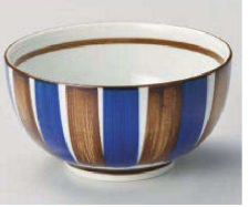
イ323-219 錆十草お好み丼 大 φ16×8.4cm(磁) JPN 1,250円 イ323-229 錆十草お好み丼 小 φ13.2×7.4cm(磁) JPN 950円