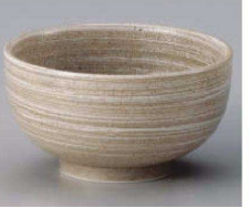
イ323-159 草月手捻5.0深丼 φ16×8.5cm(磁) JPN 1,400円