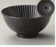
ユ323-439 KONOMI(黒)5.0和丼 φ15.5×7.8cm(磁) JPN 1,000円