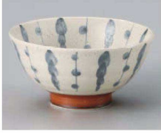
ア323-339 猫やなぎ5.0丼 φ16×7.6cm(磁) JPN 1,150円