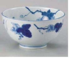
ヤ323-299 藍染ぶどう軽量丼 大 φ16×8.4cm(磁) JPN 1,100円 ヤ323-309 藍染ぶどう軽量丼 小 φ13.2×7.4cm(磁) JPN 830円