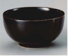
ホ323-189 ゆず天目中丼 φ16×8.3cm(磁) JPN 1,350円 ホ323-199 ゆず天目小丼 φ13.2×7.2cm(磁) JPN 980円