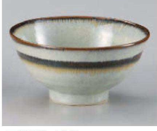
ア323-409 うのぶライン5.0多用丼(小) φ15.7×8cm(磁) JPN 950円