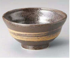
ユ323-129 万里5.5三ツ輪丼 φ17×8.5cm(磁) JPN 1,450円