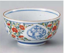
ヤ323-049 錦京唐草お好み丼(大) 16×8.5cm(磁) JPN 1,750円 ヤ323-059 錦京唐草お好み丼(小) 13.3×7.5cm(磁) JPN 1,400円