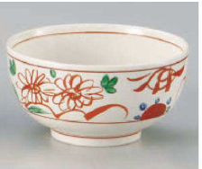
ヤ323-069 粉引古代赤絵お好み丼 大 φ16×8.4cm(磁) JPN 1,750円 ヤ323-079 粉引古代赤絵お好み丼 小 φ13×7.2cm(磁) JPN 1,400円