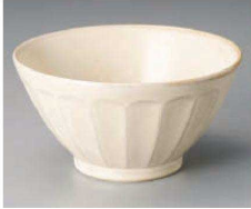
ア323-109 ブルームスグレー-Dポウル18cm φ18×9.3cm(磁) JPN 1,650円 ア323-119 ブルームスグレー-Dポウル16cm φ16×8.6cm(磁) JPN 1,350円