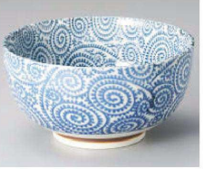
イ323-209 藍染タコ唐草16cmお好み丼(大) φ16×8.4cm(磁) JPN 1,250円