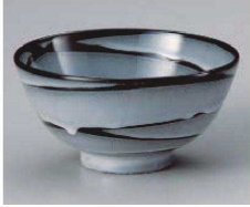
ト323-179 黒うず5.0種丼 φ16×8cm(磁) JPN 1,300円