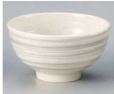
ミ323-019 粉引刷毛目5.5高浜丼 φ17×9.1cm(1100cc) (磁) JPN 2,000円 ミ323-029 粉引刷毛目5.0高浜丼 φ15.3×8.5cm(840cc) (磁) JPN 1,400円