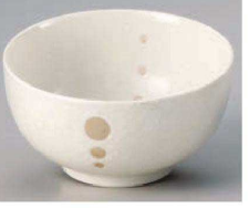
ヤ323-379 ドット白お好み丼大 16×8.4cm(磁) JPN 1,050円 ヤ323-389 ドット白お好み丼小 13×7.2cm(磁) JPN 800円