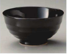
ミ323-349 天目5.5多用丼 φ17×8.8cm(磁) JPN 1,250円