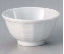
ヤ323-139 白5.5けずり丼 φ16.4×8.6cm(磁) JPN 1,400円 ヤ323-149 白5.0けずり丼 φ15.1×8.5cm(磁) JPN 1,300円