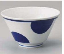
ハ323-089 ルリだま5.0反丼 φ16.8×9.5cm(磁) JPN 2,200円