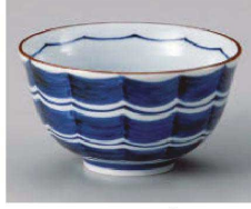
カ323-319 縹波ぶっかけ丼 φ16.2×8.8cm(磁) JPN 1,150円 カ323-329 縹波ぶっかけ小丼 φ13.2×7.5cm(磁) JPN 800円