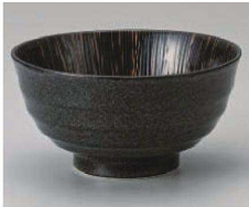
イ323-039 漆黒乱十草5.5多用鉢 φ17×8.7cm(磁) JPN 1,600円