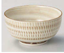
イ323-239 美濃民芸お好み丼 大 φ16×8.4cm(磁) JPN 1,250円