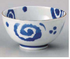
ヤ323-359 うず軽量丼 大 φ16×8.4cm(磁) JPN 1,100円 ヤ323-369 うず軽量丼 小 φ13.2×7.4cm(磁) JPN 830円