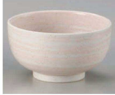
イ323-169 桃李手捻5.0深丼 φ16×8.5cm(磁) JPN 1,400円