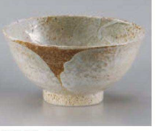
ミ323-449 雪志野5.0和丼 φ15.8×8cm(磁) JPN 1,000円