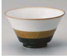
ツ323-099 色分け三彩5.0反り丼 φ17×9.4cm(900cc) (磁) JPN 1,500円