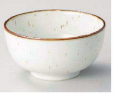
イ323-289 鉄粉流しお好み丼 大 φ16.6×8.4cm(磁) JPN 1,250円