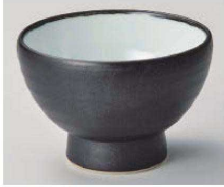
1325-189 信楽黒釉高台5.0丼 φ15×10.5cm (磁) JPN 4,200円 1325-199 信楽黒釉高台4.0丼 φ12.7×8.7cm (磁) JPN 2,900円