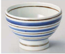
1325-169 呉須こま筋高台5.0丼 φ15×10.5cm (磁) JPN 4,200円 1325-179 呉須こま筋高台4.0丼 φ12.7×8.7cm (磁) JPN 2,900円