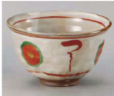
1325-029 赤絵丸紋5.0丼 φ15×9cm (陶) JPN 5,800円