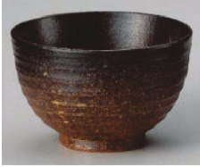
1325-219 備前黒吹夏目5.0丼 φ15.5×10cm (陶) JPN 3,900円