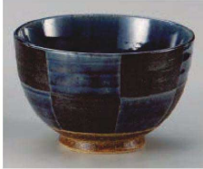
1325-259 藍市松夏目5.0丼 φ15.5×10cm (陶) JPN 3,900円