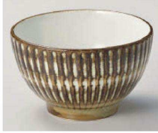
1325-299 鏗巻十草5.0丼 φ15.5×9.3cm (磁) JPN 3,850円