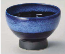
1325-139 深海うのぶ高台5.0丼 φ15×10.5cm (磁) JPN 4,200円 1325-149 深海うのぶ高台4.0丼 φ12.7×8.7cm (磁) JPN 2,900円