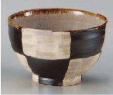
1325-269 市松夏目5.0丼 φ15.5×9.5cm (陶) JPN 4,000円