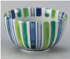
1325-059 グリーン十草4.8丼 φ14.5×8cm (磁) JPN 4,900円