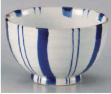
1325-369 粉引ゴス十草夏目5.0丼 φ15.5×9.8cm (陶) JPN 4,000円