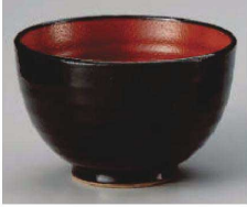
1325-329 赤と黒夏目深5.0丼 φ15.2×9.5cm (陶) JPN 3,850円