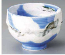
ミ325-159 ブルー割型桜木4.5丼 φ13.5×10cm (磁) JPN 4,100円