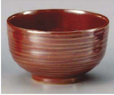
ロ325-379 紅結晶5.0丼 φ15.2×9.2cm (磁) JPN 3,540円 ロ325-389 紅結晶4.0丼 φ11.7×6.5cm (磁) JPN 1,800円 ロ325-399 紅結晶3.0丼 φ10.2×5cm (磁) JPN 1,320円