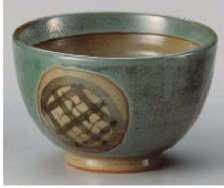
1325-309 青釉紋様夏目5.0丼 φ15×9.5cm (陶) JPN 3,900円