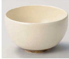
カ325-339 白瀬戸丸丼 φ15.5×9.1cm (陶) JPN 3,580円