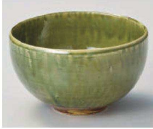
カ325-359 オリベ丸丼 φ15.5×9.1cm (陶) JPN 3,580円