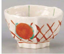
ミ325-069 朱丸紋六角丼 15.2×16.2×9.2cm (磁) JPN 4,500円 ミ325-079 朱丸紋六角4.5丼 14.2×13.5×8.3cm (磁) JPN 3,380円 ミ325-089 朱丸紋六角4.0丼 12.7×12.3×7.3cm (磁) JPN 3,000円