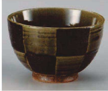
1325-249 織部市松夏目5.0丼 φ15.5×10cm (陶) JPN 3,900円