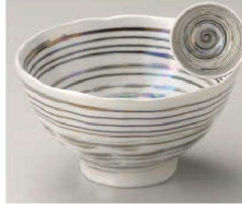
オ325-229 ラスター銀彩渦潮5.0変形丼 φ15.5×8.6cm (磁) (美濃焼) JPN 4,000円 オ325-239 ラスター銀彩渦潮4.0変形丼 φ12×7.7cm (磁) (美濃焼) JPN 3,000円