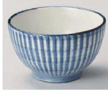
1325-289 呉須巻十草5.0丼 φ15.5×9.3cm (磁) JPN 3,850円