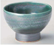
1325-209 緑彩辰砂高台5.0丼 φ15×10.5cm (磁) JPN 4,200円