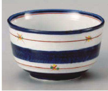
ア325-099 錦天の川5.0夏目丼 φ14.7×8.4cm (磁) JPN 4,500円