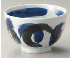
1325-279 荒波 夏目5.0丼 φ15.5×10cm (陶) JPN 2,600円