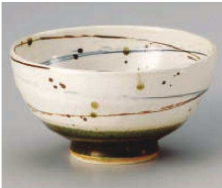
1325-049 オリベ乱線5.0丼 φ15.4×8.2cm (陶) JPN 5,500円