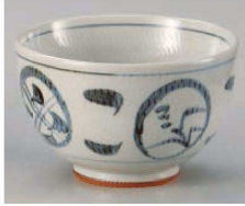
ミ325-349 トチリ草紋5.0牛丼 φ15×9.5cm (陶) JPN 3,550円