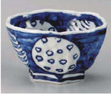
1325-119 染付丸紋六角5.0丼 φ15.5×9cm (磁) JPN 4,300円 1325-129 染付丸紋六角4.5丼 φ14×8.4cm (磁) JPN 3,000円