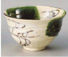
1325-109 織部流水5.0丼 φ15×9cm (陶) JPN 4,350円