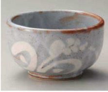
1325-319 青嵐志野イナホ腰張5.0丼 φ15.8×9.2cm (陶) JPN 4,500円