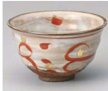
1325-019 赤絵波5.0丼 φ15×9cm (陶) JPN 5,800円