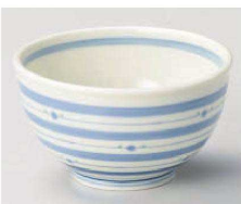
ホ331-099 ぶるーライン多用丼(軽量) φ13.2×7.5cm (藍) JPN 1,250円