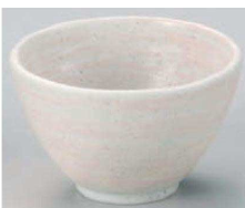
イ331-049 桃李手捻姫丼 φ13.1×8.2cm (藍) JPN 1,200円