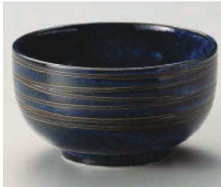
イ331-249 雲海お好み碗 φ13×7.2cm (藍) JPN 850円