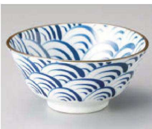
ツ331-329 藍波14cm多用丼 φ14.2×6.5cm (藍) JPN 990円