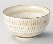
イ331-219 美濃民芸お好み丼 小 φ13.2×7.4cm (藍) JPN 950円