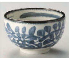
カ331-079 藍唐草4.2多用丼 φ13×8cm (藍) JPN 1,320円 カ331-089 藍唐草4.0多用丼 φ12.5×7.5cm (藍) JPN 1,100円