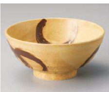
ツ331-029 刷毛山吹讃岐丼(小) φ16×8cm (藍) JPN 1,250円