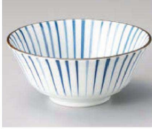
ツ331-299 藍十草15.5cm多用丼 φ15.5×6.7cm (藍) JPN 1,080円