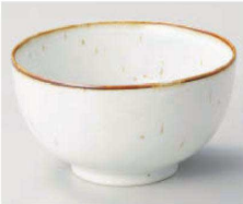
イ331-229 鉄粉流しお好み丼 小 φ13.2×7.4cm (藍) JPN 950円