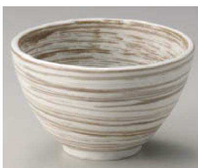
イ331-059 うず刷毛白釉 姫丼 φ13.3×8cm (藍) JPN 1,200円