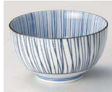
イ331-209 細十草お好み丼 小 φ13.2×7.4cm (藍) JPN 950円