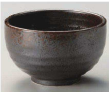
カ331-159 蒼月4.2多用丼 φ13×8cm (藍) JPN 1,320円 カ331-169 蒼月4.0多用丼 φ12.5×7.5cm (藍) JPN 1,100円