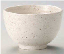
カ331-239 白唐津多用碗 φ12.3×8cm (藍) JPN 860円