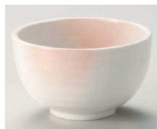
タ331-069 あけぼの定食丼 φ12.5×7.4cm (藍) JPN 1,200円