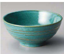
ツ331-039 若草讃岐丼(小) φ16×8cm (藍) JPN 1,250円