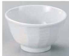
ヤ331-129 白4.5けずり丼 φ13.8×8cm (藍) JPN 1,100円 ヤ331-139 白4.0けずり丼 φ12.8×7.5cm (藍) JPN 930円