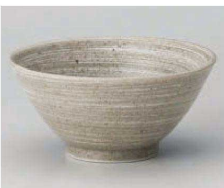
イ331-319 草月手引4.0和丼 φ13×6.2cm (藍) JPN 800円