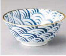
ツ331-289 藍波15.5cm多用丼 φ15.5×6.7cm (藍) JPN 1,080円