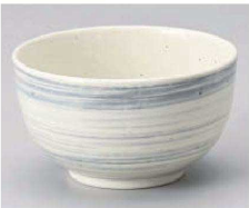
キ331-149 うず粉引グレー4.0丼 φ13×7cm (藍) JPN 1,050円