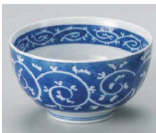
ヤ331-349 濃夕コ唐草お好み小 φ13×7.2cm (藍) JPN 800円