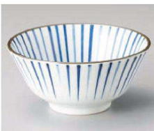
ツ331-339 藍十草14cm多用丼 φ14.2×6.5cm (藍) JPN 990円