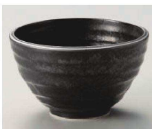
ハ331-119 黒水晶荒引茶漬丼 φ13.3×7.9cm (藍) JPN 1,200円