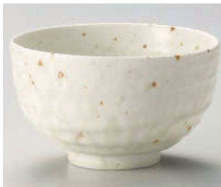
カ331-199 白いらぼお茶丼 φ13×7.7cm (藍) JPN 980円