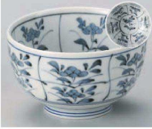
ツ331-279 古染菜々4.0京丼 φ13×7.5cm (藍) JPN 860円