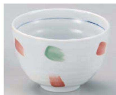
ツ331-019 パステルたもり碗 φ12×8cm (藍) JPN 1,250円