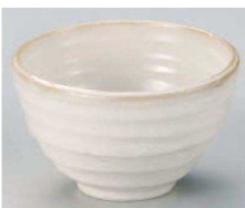
ハ331-109 粉引荒引茶漬丼 φ13.3×7.9cm (藍) JPN 1,200円