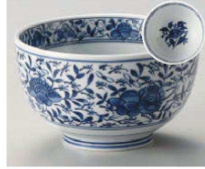
ツ331-259 唐草古紋4.0京丼 φ13×7.5cm (藍) JPN 860円