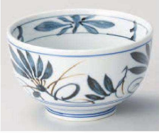
ツ331-269 古染輪花4.0京丼 φ13×7.5cm (藍) JPN 880円