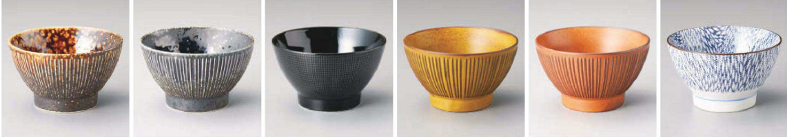
フ336-079 雨流 唐茶千段くらわんか4.0断碗 φ11.8×7.2cm (藍) JPN 1,100円 フ336-089 雨流 花紺千段くらわんか4.0断碗 φ11.8×7.2cm (藍) JPN 1,100円 フ336-099 雨流 唐茶千段くらわんか3.6碗 φ10.8×6.2cm (藍) JPN 950円 フ336-109 雨流 花紺千段くらわんか3.6碗 φ10.8×6.2cm (藍) JPN 950円 フ336-119 銀彩十草くらわんか4.0断碗 φ11.8×7.1cm (380cc) (藍) JPN 1,100円 フ336-129 銀彩十草くらわんか3.6碗 φ10.8×6.2cm (藍) JPN 1,000円 フ336-139 雫がれ かしら千段くらわんか4.0断碗 φ11.8×7.2cm (藍) JPN 1,000円 フ336-149 雫がれ かしら千段くらわんか3.6碗 φ10.8×6.2cm (藍) JPN 850円 フ336-159 雫がれ 柿千段くらわんか4.0断碗 φ11.8×7.2cm (藍) JPN 1,000円 フ336-169 雫がれ 柿千段くらわんか3.6碗 φ10.8×6.2cm (藍) JPN 850円 フ336-179 むじな菊くらわんか4.0断碗 φ11.8×7.1cm (380cc) (藍) JPN 1,000円 フ336-189 むじな菊くらわんか3.6碗 φ10.8×6.2cm (藍) JPN 900円

多用丼 (30cm~20cm) 多用丼 (20cm~18cm) 多用丼 (18cm~16cm) 多用丼 (16cm~15cm) 多用丼 (15cm~13cm)