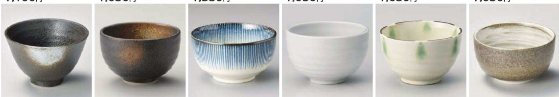
ヤ336-399 白吹天目平成茶漬 φ13×8cm (藍) JPN 1,100円 カ336-409 黒備前吹きいっぶく碗 φ10.7×6.2cm (藍) JPN 1,100円 テ336-419 江戸十草4.1多用丼 φ12.8×7cm (520cc) (藍) JPN 1,000円 ネ336-429 化粧刷毛飯器 φ10.5×6.6cm (藍) JPN 1,200円 オ336-439 窯炎 測鑄点紋3.6丼お好み碗 φ11×7cm (藍) JPN 1,150円 ホ336-449 旋風(黒)多用碗(小) φ13×7cm (藍) JPN 1,050円

土 鍋 小 鍋 陶 板 タジン鍋 すっぽん鍋 ビビンバ その他 鍋小物 土短冊 コンロ 敷 板 すり鉢