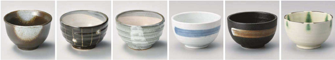
ホ336-019 白吹天目反多用碗(小) φ11.5×7.3cm (藍) JPN 1,200円 ト336-029 丸十草黒丸碗 φ11.5×7.3cm (陶) JPN 1,250円 ト336-039 年輪白丸碗 φ11.5×7.3cm (陶) JPN 1,250円 ヤ336-049 清瀬定食丼 φ12.5×8cm (藍) JPN 1,250円 ヤ336-059 白ハケ天目定食丼 φ12.5×8cm (藍) JPN 1,250円 オ336-069 窯炎 測鑄点紋4.0丼お好み碗 φ12×8cm (藍) JPN 1,300円

多用丼 (30cm~20cm) 多用丼 (20cm~18cm) 多用丼 (18cm~16cm) 多用丼 (16cm~15cm) 多用丼 (15cm~13cm)