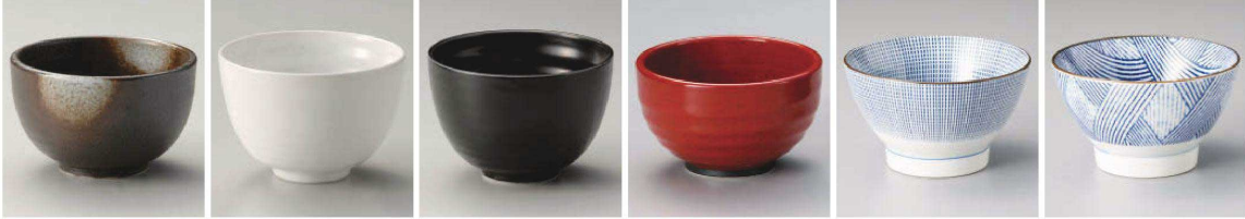
ヤ336-199 白吹天目 定食丼 φ12.5×7.4cm (藍) (美濃焼) JPN 1,250円 ミ336-209 白釉 多用 小丼 φ12×8.3cm (藍) JPN 1,100円 ミ336-219 黒釉 多用 小丼 φ12×8.3cm (藍) JPN 1,100円 ネ336-229 赤釉子 4.0多用丼 φ12.5×7.5cm (藍) JPN 1,180円 フ336-239 千段十草くらわんか4.0断碗 φ11.8×7.1cm (380cc) (藍) JPN 1,000円 フ336-249 千段十草くらわんか3.6碗 φ10.8×6.2cm (藍) JPN 900円 フ336-259 縞格子くらわんか4.0断碗 φ11.8×7.1cm (380cc) (藍) JPN 1,000円 フ336-269 縞格子くらわんか3.6碗 φ10.8×6.2cm (藍) JPN 900円