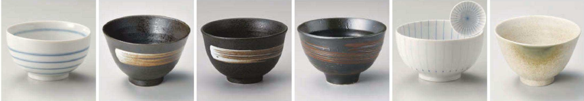
キ336-279 ボーダー 多用碗 φ13.5×7.3cm (藍) JPN 1,050円 ヤ336-289 白刷毛天目平成茶漬 φ13×8.2cm (藍) JPN 1,200円 ヤ336-299 白ハケ天目反タモリ碗 φ13×8cm (藍) JPN 1,200円 ツ336-309 幽谷反六兵衛4.0丼 φ13×8.2cm (藍) JPN 1,150円 キ336-319 ピンストライプ多用碗 φ13.5×7.3cm (藍) JPN 1,050円 ヤ336-329 織部砂茶平成茶漬 φ13×8cm (藍) JPN 1,100円