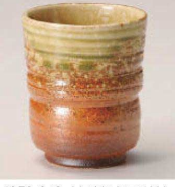
×359-249 古信楽切立湯呑(中) φ7.7×9.3cm (240cc) (陶) 信楽焼 JPN 1,650円 ×359-259 古信楽切立湯呑(小) φ6.8×9cm (200cc) (陶) 信楽焼 JPN 1,500円