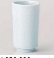
カ359-339 青白長湯呑 5.5×10cm (140cc) (磁) JPN 1,700円