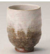
×359-109 灰釉粉引湯呑(大) φ7.5×9.3cm (220cc) (陶) 信楽焼 JPN 2,750円 ×359-119 灰釉粉引湯呑(小) φ6.8×8.5cm (180cc) (陶) 信楽焼 JPN 2,500円