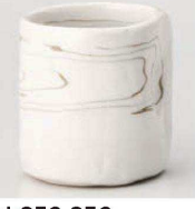
カ359-359 ねり込みペコ湯呑 φ6.5×7.6cm (170cc) (陶) JPN 1,450円