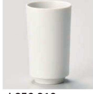
カ359-319 ストーンマット長湯呑 φ5.8×10cm (170cc) (磁) JPN 1,900円