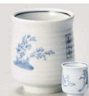
ツ359-039 高山寺湯呑 φ7×8cm (170cc) (陶) JPN 2,700円