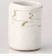
カ359-269 ねり込み湯呑(中) φ6.2×8.5cm (180cc) (陶) JPN 1,550円 カ359-279 ねり込み湯呑(小) φ5.5×8.3cm (120cc) (陶) JPN 1,450円