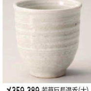
×359-389 若草反長湯呑(大) φ7.5×8cm (210cc) (陶) 信楽焼 JPN 1,650円 ×359-399 若草反長湯呑(小) φ7.7×5cm (160cc) (陶) 信楽焼 JPN 1,600円