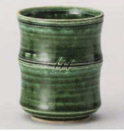
ミ359-199 手造り織部竹筋長湯呑 φ7×8.5cm (220cc) (陶) JPN 2,100円