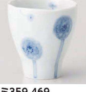
ミ359-469 ボンボン綿花湯呑 7.6×8cm (210cc) (磁) JPN 2,000円