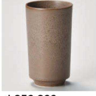
カ359-329 グレージュ長湯呑 φ5.8×10cm (170cc) (磁) JPN 1,800円