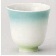
ア359-179 カラーグラデーションヒスイ湯呑 φ8×8cm (180cc) (磁) JPN 2,000円