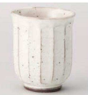
ネ359-139 粉引面取湯呑(大) φ7.1×8.8cm (220cc) (陶) JPN 2,000円 ネ359-149 粉引面取湯呑(小) φ6.6×8.3cm (170cc) (陶) JPN 2,000円