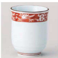
ウ359-029 赤濃花鳥長湯呑 φ6.7×8.2cm (180cc) (陶) JPN 2,730円