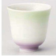
ア359-169 カラーグラデーションパープル湯呑 φ8×8cm (180cc) (磁) JPN 2,000円