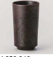
カ359-349 黒マット長湯呑 5.5×10cm (140cc) (磁) JPN 1,700円