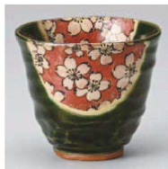
口359-079 織部舞桜湯呑 φ9.5×8.3cm (260cc) (陶) JPN 2,400円