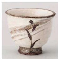
ミ359-019 手造り粉引芦湯呑 φ9.6×8cm (240cc) (陶) JPN 2,750円