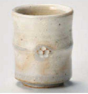
ミ359-189 手造り粉引華紋(土物)長湯呑 φ7×8.5cm (185cc) (陶) JPN 2,100円