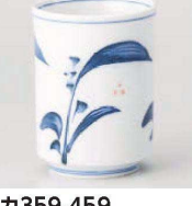
カ359-459 清里長湯呑 6.5×8.5cm (180cc) (陶) JPN 1,800円