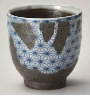
工359-219 化粧流刺子湯呑 φ8×8.3cm (220cc) (陶) JPN 1,850円