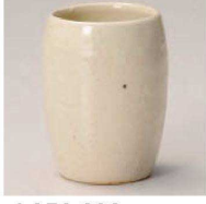
カ359-239 粉引たる湯呑 φ5.5×7.5cm (120cc) (陶) JPN 1,750円