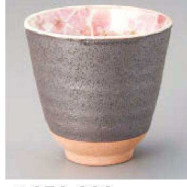
ハ359-229 粉引舞桜湯呑(ピンク) φ8.3×8cm (220cc) (陶) JPN 1,450円