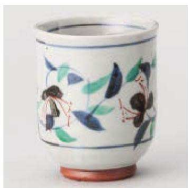
ネ359-089 唐草湯呑(大) φ7.9cm (190cc) (陶) JPN 2,550円 ネ359-099 唐草湯呑(小) φ6.5×8.3cm (170cc) (陶) JPN 2,550円