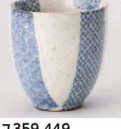
工359-449 白砂波鹿の子湯呑 φ8×8.5cm (250cc) (陶) JPN 1,600円