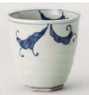
ア359-159 藍古染長湯呑大 φ8.5×8.5cm (240cc) (磁) JPN 2,000円