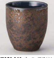
ア359-369 グータン湯呑(大) φ8×8.6cm (270cc) (陶) JPN 1,550円 ア359-379 グータン湯呑(小) φ7.3×7.4cm (190cc) (陶) JPN 1,300円