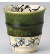
ハ359-059 織部草花湯呑 φ8×8.4cm (235cc) (陶) JPN 3,350円