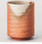
×359-299 きなり切立湯呑(大) φ7.5×10cm (290cc) (陶) JPN 1,650円 ×359-309 きなり切立湯呑(小) φ6.5×8.5cm (170cc) (陶) JPN 1,600円