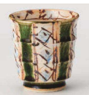
ハ359-069 織部ベルジャ紋湯呑 φ8×8.2cm (240cc) (陶) JPN 3,450円