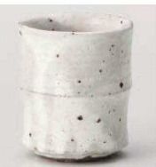
カ359-129 新粉引切立湯呑 φ7.7×9cm (250cc) (陶) JPN 2,200円