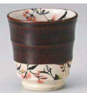
ハ359-049 アメ釉草花湯呑 φ8×8.4cm (235cc) (陶) JPN 3,350円