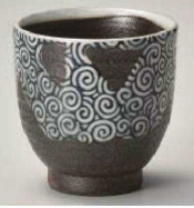
工359-209 化粧流渦湯呑 φ8×8.3cm (220cc) (陶) JPN 1,850円