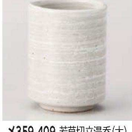
×359-409 若草切立湯呑(大) φ7.5×9.5cm (290cc) (陶) JPN 1,650円 ×359-419 若草切立湯呑(小) φ6.5×8.5cm (180cc) (陶) JPN 1,600円