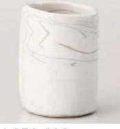
カ359-289 ねり込み湯呑(大) φ6.8×9cm (240cc) (陶) JPN 1,600円