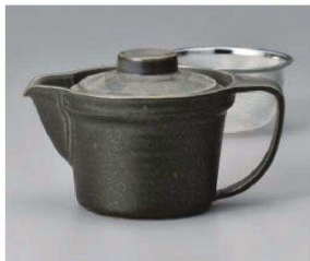
ヨ371-089 シルバー広口ピターポット 16.2×10.8×9cm(320cc) (磁) JPN 3,600円