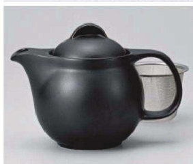
ア371-019 シンプルサークル黒マットポット 大 φ11×18×13cm(620cc) (磁) JPN 3,850円