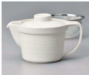
ヨ371-079 白マット広口ピターポット 16.2×10.8×9cm(320cc) (磁) JPN 3,600円