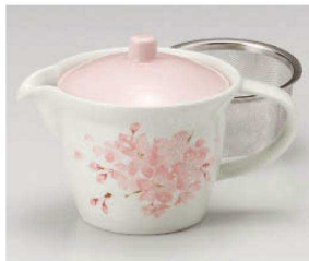
キ371-059 花かんざしポット(茶こし付) 300cc (磁) JPN 3,960円