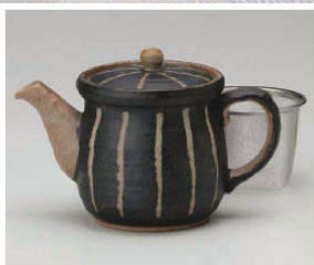
□371-049 紺十草ポット 16×9.5×11.5cm(460cc) (陶) JPN 4,600円