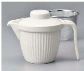
ヨ371-109 白マットさかのポット 15.5×11×11.5cm(390cc) (磁) JPN 3,600円