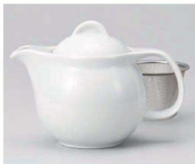
ア371-129 シンプルサークル白ポット 小 φ10.5×15.5×11.5cm(440cc) (磁) JPN 3,300円