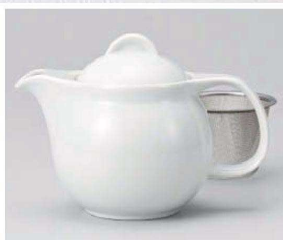
ア371-029 シンプルサークル白ポット 大 φ11×18×13cm(620cc) (磁) JPN 3,850円