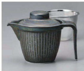
ヨ371-099 シルバーさかのポット 15.5×11×11.5cm(390cc) (磁) JPN 3,600円