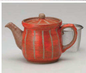
□371-039 赤十草ポット 16×9.5×11.5cm(460cc) (陶) JPN 4,600円