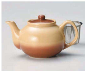
ハ371-069 Sha-La-Laポット(U) 500cc (陶) CHN 3,900円