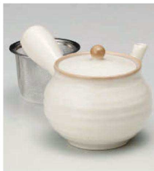
ハ373-129 粉引新型六兵衛急須 450cc (磁) JPN 4,000円