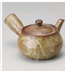
×373-059 窯変2合急須 φ11×9.5cm (380cc) (陶) JPN 4,950円