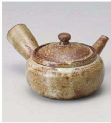
×373-069 1.5合窯変浅急須 φ10.8×8.5cm (300cc) (陶) JPN 4,400円