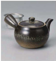
ホ373-159 茶吹き急須(カップアミ) φ10.8×9.3cm (360cc) (磁) CHN 3,600円