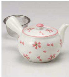
キ373-179 (軽量)淡雪さくら急須(茶こし付) 350cc (磁) CHN 3,150円