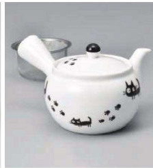
ホ373-189 黒ねこ急須(カップアミ) φ10.8×9.5cm (360cc) (磁) CHN 3,000円