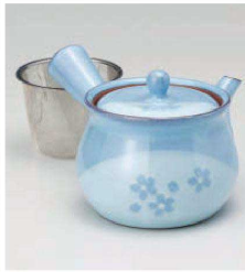
ア373-079 花しずく5号大急須(茶コシ付) 13.5×12.5cm (900cc) (陶) JPN 5,200円