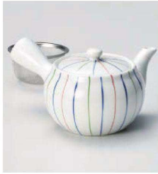
ホ373-219 三色ライン急須(カップアミ) φ10.8×8.5cm (380cc) (磁) CHN 3,000円