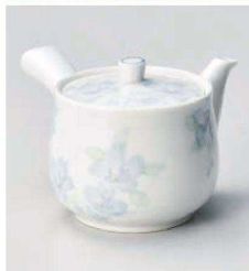
オ373-099 花のささやき 急須 16.6×15×10.8cm (磁) JPN 5,800円