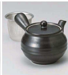
ハ373-139 黒六兵衛急須 450cc (磁) JPN 4,000円