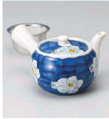
ホ373-199 タミ間取花急須(カップアミ) φ10.8×8.5cm (380cc) (磁) CHN 3,000円