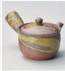
×373-089 1.5合赤ビードロ深急須 φ9.8×9.5cm (300cc) (陶) JPN 4,400円