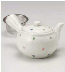
キ373-169 (軽量)淡雪水玉急須(茶こし付) 350cc (磁) CHN 3,150円