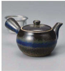
ホ373-149 青吹き急須(カップアミ) φ10.8×9.3cm (360cc) (磁) CHN 3,600円