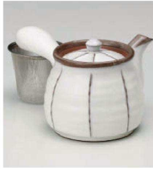
イ373-229 京十草六兵衛急須(アミ付) 10×10cm (450cc) (陶) JPN 3,000円