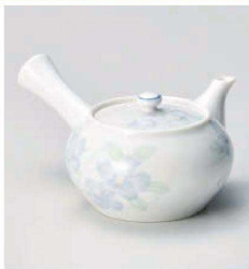
オ373-109 花のささやき 京型急須 17×13.5×10.7cm (磁) JPN 5,150円