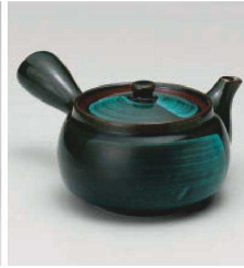
ホ373-239 新青釉急須(帯アミ) φ11×7.5cm (400cc) (陶) JPN 2,980円