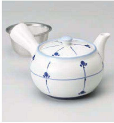
ホ373-209 めばえ急須(カップアミ) φ10.8×8.5cm (380cc) (磁) CHN 3,000円