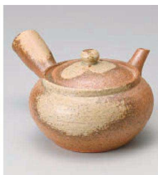
×373-049 信楽急須(小) φ13.5×7.5cm (600cc) (陶) JPN 7,600円