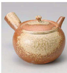
×373-039 信楽急須(大) φ13.5×9.5cm (750cc) (陶) JPN 8,800円