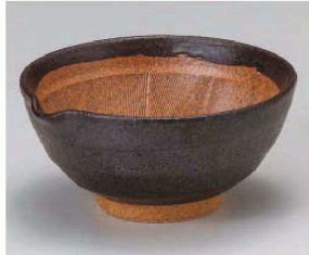
1.395-089 黒結晶片口6.0鉢 18×9cm(陶)JPN 3,980円 1.395-099 黒結晶片口5.0鉢 15.5×7.5cm(陶)JPN 3,300円