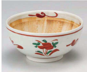
ヤ395-109 立花灰釉6.0スリ鉢 φ18.5×9cm(磁)JPN 3,900円 ヤ395-119 立花灰釉5.0スリ鉢 φ15.5×7.5cm(磁)JPN 2,900円