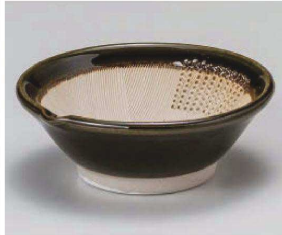
オ395-149 織部4.0スリオロシ 12.2×12×4.5cm(陶)JPN 1,950円 オ395-159 織部3.2スリオロシ 10.2×9.8×3.5cm(陶)JPN 1,700円