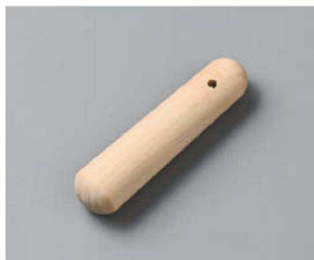
カ395-269 10cmすり棒 10×2.5cm(木)CHN 550円