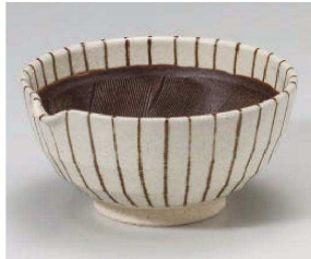
1.395-019 鑄十草片口6.0鉢 19×18×9cm(陶)JPN 4,000円 1.395-029 鑄十草片口5.0鉢 16×15.5×7.5cm(陶)JPN 3,300円