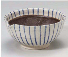
1.395-039 青十草片口6.0鉢 19×18×9cm(陶)JPN 4,000円 1.395-049 青十草片口5.0鉢 16×15.5×7.5cm(陶)JPN 3,300円