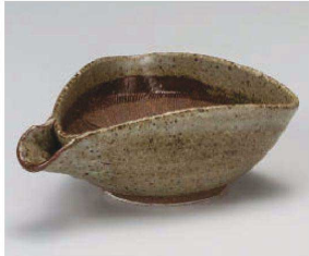
オ395-129 唐津花紋片口(中) 17.5×13×6.8cm(陶)JPN 5,150円 オ395-139 唐津花紋片口(小) 14.5×11×5cm(陶)JPN 3,950円