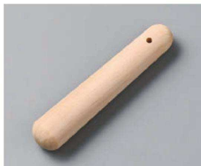
カ395-259 すり棒 13cm 13×2.5cm(木)CHN 650円