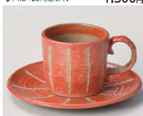
口542-379 赤十草コーヒー碗 11×7.3×6.5cm (150cc) (陶) JPN 1,800円 口542-389 赤十草コーヒー皿 φ15×1.5cm (陶) JPN 1,650円