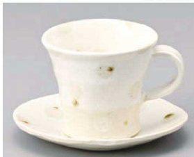
オ542-199 織部ドット&ホワイトコーヒー碗 13.9×12.5×8.1cm (陶) JPN 2,700円 オ542-209 織部ドット&ホワイトコーヒー皿 13.9×12.5×1.9cm (陶) JPN 2,250円