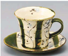
オ542-179 まほろば織部コーヒー碗 11.5×9×7.5cm (陶) JPN 2,700円 オ542-189 まほろば織部コーヒー皿 13.9×12.5×1.9cm (陶) JPN 2,250円