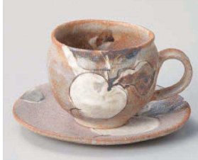
ト542-039 鼠志野カブコーヒー碗 φ8.5×6.8cm (240cc) (陶) JPN 3,200円 ト542-049 鼠志野カブコーヒー受皿 φ14×1.3cm (陶) JPN 2,400円