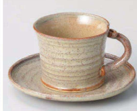
口542-079 手造りウノフコーヒー碗 11.7×9.1×7.7cm (180cc) (陶) JPN 2,780円 口542-089 手造りウノフコーヒー皿 φ15.2×2cm (陶) JPN 1,600円