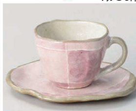
カ542-319 ピンク色十草タタラコーヒー碗 10.7×8.8×6.1cm (190cc) (陶) JPN 1,950円 カ542-329 ピンク色十草タタラコーヒー皿 14.5×12.6×1.6cm (陶) JPN 1,550円