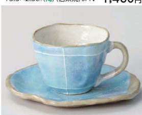
カ542-339 ブルー色十草タタラコーヒー碗 10.7×8.8×6.1cm (190cc) (陶) JPN 1,950円 カ542-349 ブルー色十草タタラコーヒー皿 14.5×12.6×1.6cm (陶) JPN 1,550円