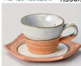
ト542-399 乱線彫りコーヒー碗 φ8.2×6cm (150cc) (陶) JPN 1,850円 ト542-409 乱線彫りコーヒー受皿 14×14.5×1cm (陶) JPN 1,900円