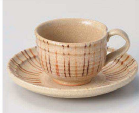
口542-059 十草コーヒー碗 11×8.8×6cm (180cc) (陶) JPN 2,780円 口542-069 十草コーヒー皿 φ15×2.5cm (陶) JPN 1,600円