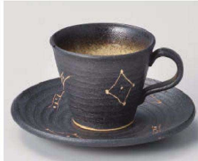
口542-139 黒吹絵彫りコーヒー碗 11×8.5×7cm (140cc) (陶) JPN 2,780円 口542-149 黒吹絵彫りコーヒー皿 φ15×2cm (陶) JPN 1,420円