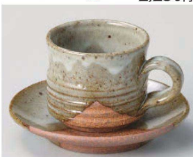
×542-259 掛分け切立コーヒー碗 7.5×6.5cm (180cc) (陶) (信楽焼) JPN 2,170円 ×542-269 掛分け切立コーヒー皿 13.5×2.5cm (陶) (信楽焼) JPN 1,460円