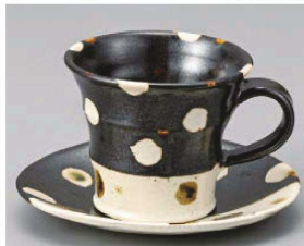
オ542-219 織部ドット&ブラックコーヒー碗 11.5×9×8.1cm (陶) JPN 2,700円 オ542-229 織部ドット&ブラックコーヒー皿 13.9×12.5×1.9cm (陶) JPN 2,250円