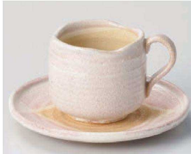
口542-119 桜志野コーヒー碗 11×8.2×7cm (200cc) (陶) JPN 2,780円 口542-129 桜志野コーヒー皿 φ10.5×2cm (陶) JPN 1,600円