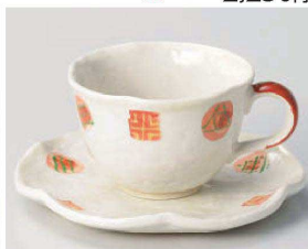
口542-299 粉引小紋コーヒー碗 11.4×9.3×6.3cm (200cc) (陶) JPN 2,500円 口542-309 粉引小紋コーヒー皿 φ14.5×2cm (陶) JPN 1,300円