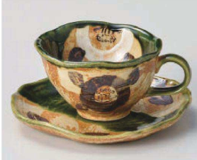
オ542-019 織部山茶花コーヒー碗 φ10.5×6.5cm (240cc) (陶) JPN 3,350円 オ542-029 織部山茶花コーヒー皿 15.7×15cm (陶) JPN 2,400円