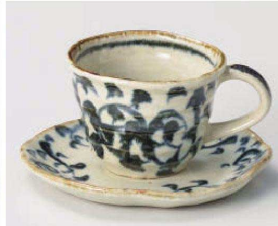
オ542-159 タコ唐草コーヒー碗 φ10.5×9.5×7.3cm (240cc) (陶) JPN 2,650円 オ542-169 タコ唐草コーヒー皿 15.4×14.6cm (陶) JPN 1,900円