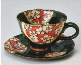
口542-099 織部舞桜コーヒー碗 13×10.4×6.8cm (240cc) (陶) JPN 2,480円 口542-109 織部舞桜銘々皿(コーヒー受皿) φ14.8×1.3cm (陶) JPN 1,600円