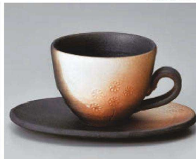
×542-239 白ぼかし小花コーヒー碗 11.5×9×6.8cm (230cc) (陶) JPN 2,250円 ×542-249 白ぼかし小花コーヒー皿 15.8×11.8×2.5cm (陶) JPN 1,750円