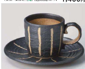
口542-359 紺十草コーヒー碗 11×7.3×6.5cm (150cc) (陶) JPN 1,800円 口542-369 紺十草コーヒー皿 φ15×1.5cm (陶) JPN 1,650円