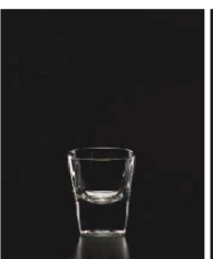
イ569-249 アラザ ショット 55ml 5.5×6cm (55cc) THA 950円