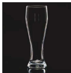
イ569-069 スタンダードビール 415 φ6.9×19.9cm (415cc) TUR 1,300円