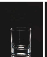
イ569-139 ショットタンブラー 220 φ7.4×8.8cm (220cc) TUR 800円