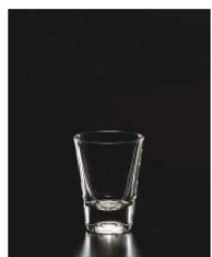
イ569-239 ソロ ショット 60ml 5.4×7cm (60cc) THA 830円