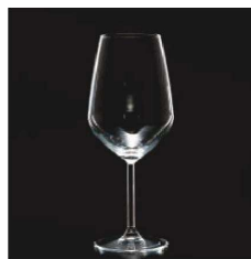
イ569-019 アレグラワイン (L) φ6.4×9.1×21.8cm (490cc) TUR 2,200円