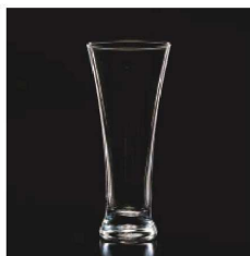
イ569-079 スタンダードビール 320 φ8×18cm (320cc) TUR 1,150円