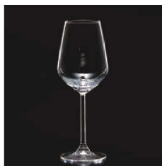
イ569-029 アレグラワイン (M) φ5.7×8.3×21.7cm (350cc) TUR 1,900円