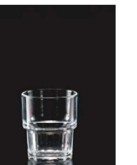
イ569-159 ネクストタンブラー (S) φ6.7×7.9cm (165cc) TUR 710円