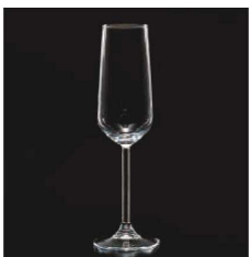
イ569-039 アレグラフルートシャンパン φ4.5×7×22.6cm (195cc) TUR 1,800円