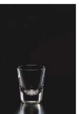
イ569-289 ショットグラス 45 φ5×5.9cm (45cc) TUR 680円