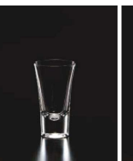
イ569-209 ショットグラス 60 φ5.2×8.9cm (60cc) TUR 750円