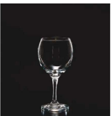
イ569-049 ビストロワイン (L) φ6.8×8.2×16cm (290cc) TUR 1,300円