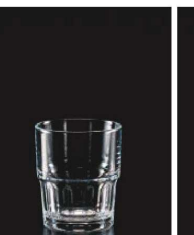
イ569-149 ネクストタンブラー (M) φ7.2×8.4cm (200cc) TUR 760円