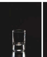
イ569-269 スタンダードショットグラス 53 φ4.5×6.8cm (53cc) TUR 600円