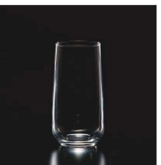
イ569-109 アレグラタンブラー 470 φ6.6×7.8×14.8cm (470cc) TUR 1,600円