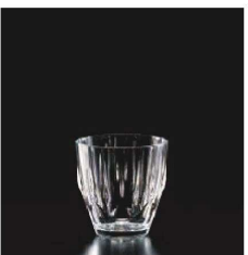
イ569-099 ダイヤタンブラー (M) φ8.5×8.7cm (275cc) TUR 950円