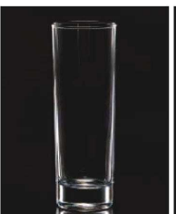
イ569-129 スタンダードトルタンブラー 290 φ6×16.6cm (290cc) TUR 840円