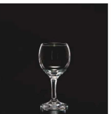
イ569-059 ビストロワイン (M) φ6.4×7.6×14.7cm (225cc) TUR 1,250円