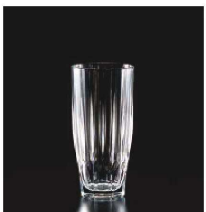
イ569-089 ダイヤタンブラー (L) φ7×14.5cm (315cc) TUR 1,000円