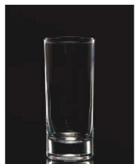
イ569-119 スタンダードタンブラー 290 φ6.3×14.1cm (290cc) TUR 800円