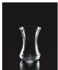
イ569-179 ティーコップ 125 φ6×9cm (125cc) TUR 780円