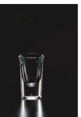
イ569-229 ショットグラス 25 φ4.4×7.1cm (25cc) TUR 580円