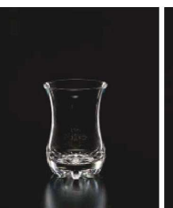
イ569-199 ティーコップ 110 φ5.9×8.6cm (110cc) TUR 660円