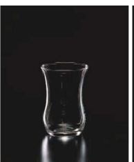
イ569-189 ティーコップ 120 φ5.7×8.3cm (120cc) TUR 620円