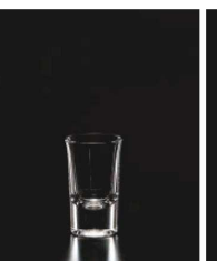
イ569-259 ショットグラス 40 φ4.4×7.1cm (40cc) TUR 680円