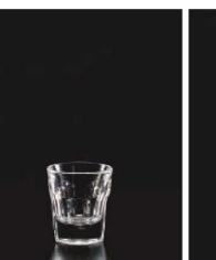
イ569-279 カサブランカショットグラス 36 φ4.8×5.5cm (36cc) TUR 520円