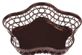
又631-019 ABS花かご 総新溜 34.5×32.3×6.2cm JPN 6,100円