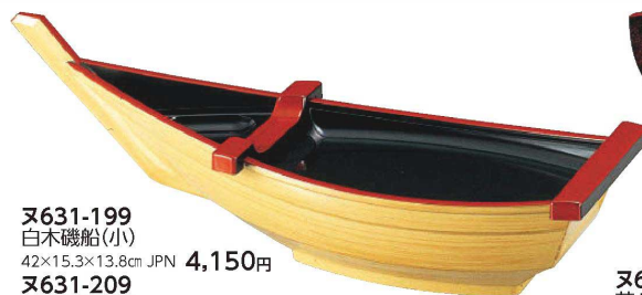
又631-199 白木磯船(小) 42×15.3×13.8cm JPN 4,150円