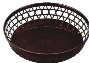
ABS竹丸かご 溜パール 又631-099 23cm φ23.1×4.8cm JPN 3,200円 又631-109 27cm φ27.1×4.8cm JPN 3,500円 又631-119 31cm φ31.3×6.1cm JPN 5,700円