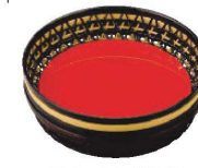
ABS竹丸かご 総黒内朱 又631-129 23cm φ23.1×4.8cm JPN 3,350円 又631-139 27cm φ27.1×4.8cm JPN 3,850円 又631-149 31cm φ31.3×6.1cm JPN 5,800円