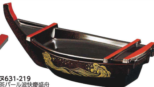
又631-219 茶パール波快慶盛舟 35×12.7×13cm JPN 5,150円

ABS樹脂・熱可塑性樹脂 [AC] アクリル樹脂・熱可塑性樹脂 [M] 熱硬化性樹脂・メラミン樹脂またはユリア樹脂 [木質] 木粉混合樹脂・熱硬化性樹脂 [TM] 熱硬化特殊樹脂 [洗淨機可]