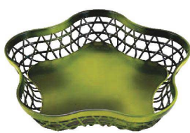
又631-029 ABS花かご 若竹裏黒乾漆 34.5×32.3×6.2cm JPN 7,100円