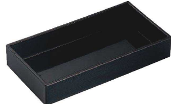
I636-029 [TA]8寸遊菜箱 黒へぎ目 [洗] 24.4×12.6×4.5cm 内寸23.3×11.5×3.9cm JPN 2,750円