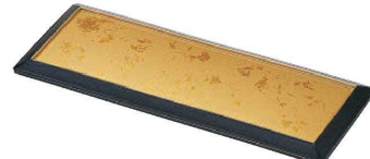
I636-079 [TA]ダイヤ盛皿 色紙金箔測黒 (H.C塗) [洗] 28.2×11×1.9cm JPN(有効内寸 25×8cm) 4,350円