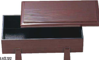
[A]足付へぎ目盛器 I636-099 [A]足付へぎ目盛器溜内黒 本体 24.2×15×7.6cm・内寸23.2×11.6×H4.9cm JPN 2,550円 I636-109 [A]足付へぎ目盛器溜内黒 蓋 24.2×12.6×1.6cm JPN 1,550円