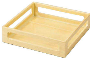
I636-129 [A]7寸角透かし盛器 白木木目塗 21×21×5.5cm・内寸19.5×19.5×H5cm JPN 4,300円