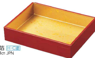
I636-179 [A](大)長角盛箱 朱内色紙金箔 (H.C塗) 21.2×16.7×4.6cm・内寸20.1×15.5×4cm JPN 4,000円

[TA] 耐熱ABS樹脂 [洗浄機可] [洗] 洗浄機を利用される場合、設定温度を80℃以下でお願いします。 [A] ABS樹脂・熱可塑性樹脂 [S-H塗] 表面が硬質で、キズ、汚れを防止します。