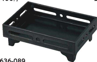
I636-089 [A]7.5寸長手足付透かし盛器 黒 22.4×15×7.4cm・内寸21.2×13.9×3.9cm JPN 3,300円