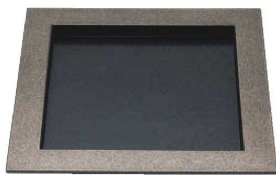
I636-059 [A]8寸つば付正角盆 銀鱗内乾漆 23×23×2cm・内寸17.4×17.4×H1.3cm JPN 2,400円