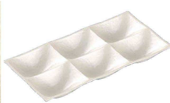
I636-019 [TA]23cmシックスコンポプレート 白アクリル [洗] 23.2×11.3×2.9cm JPN 2,700円