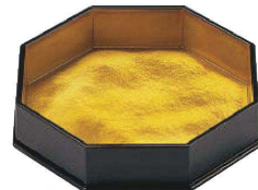
I636-119 [TA]八角盛器 金雲流測黒 [洗] 21.8×20.2×4.6cm・内寸20×18×4cm JPN 3,900円