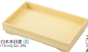
I636-169 [TA]8寸長角山路盛器 白木木目塗 [洗] 25×16.2×4.5cm・内寸23.8×15×H2.5cm JPN 4,750円