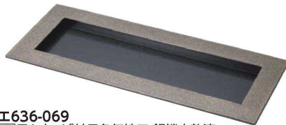
I636-069 [A]尺1寸つば付長角無地皿 銀鱗内乾漆 32.9×13.6×2cm JPN(有効内寸 27.3×8cm) 2,600円