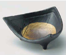
ネ064-129 黒釉満月三角小鉢 14×12×6.5cm (磁) JPN 3,050円