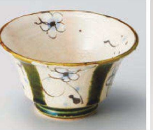
ト064-049 まほろば織部反小鉢 φ12×6.7cm (陶) JPN 3,300円