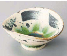
オ064-229 織部筆絵小鉢 11.5×10.5×5.5cm (陶) JPN 3,300円