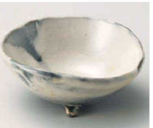
×064-239 白化粧ほかし三ツ足小鉢 φ13×6.3cm (陶) JPN 2,580円