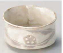
ミ064-139 手造り粉引華紋(土物)帯合せ丸小鉢 φ9.5×5cm (陶) JPN 3,500円