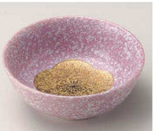
ミ064-289 紫釉金梅丸鉢 φ11.3×4.4cm (磁) JPN 3,250円