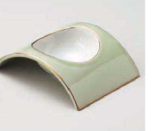
ミ064-109 若草アーチ型小付 12.8×10×3cm (磁) JPN 3,300円