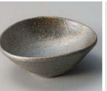
×064-249 黒銀彩3.3楕円小鉢 10×9×4cm JPN 2,900円