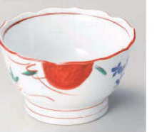
ミ064-059 染錦春日(強化) 桔梗形3.6小鉢 φ10.2×6.1cm (強) JPN 3,300円