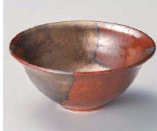
×064-069 柿釉金彩4.4小鉢 φ13.2×5.3cm (陶) JPN 3,250円