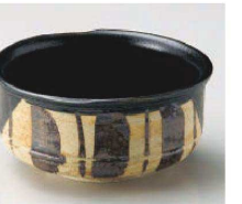
ミ064-309 黒織部十草小鉢 11.5×11×5.8cm (陶) JPN 2,900円

表示価格、仕様などは予告なく変更となる場合があります。最新情報はWEBサイトにて必ずご確認下さい(廃番合)。