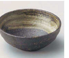
×064-259 灰刷毛目4.0小鉢 φ13×4.5cm (陶) JPN 2,500円