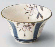
ト064-039 まほろば藍反小鉢 φ12×6.7cm (陶) JPN 3,300円