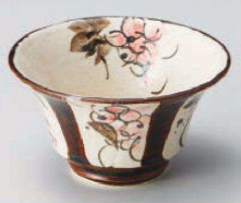
ト064-029 まほろばアメ反小鉢 φ12×6.7cm (陶) JPN 3,300円