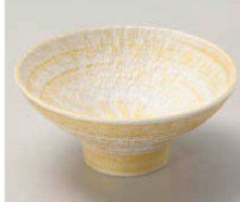
ト064-019 金ハケ目トチリ4.0小鉢 φ12×5.5cm (磁) JPN 3,850円