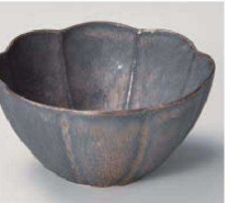
カ064-209 金結晶花型4寸小鉢 φ12.3×6.2cm (磁) JPN 2,800円