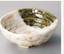
ツ064-299 白タタキサビ木ロクロ目小鉢 φ13×5.5cm (磁) JPN 2,700円