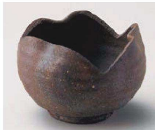
×064-219 炭化窯変割山椒小鉢 φ10.5×8cm (陶) JPN 2,600円