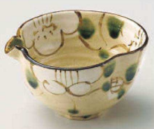
ツ064-079 格子花片口4.0小鉢 13.8×13×7cm (陶) JPN 3,000円