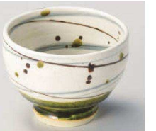
コ064-159 織部粉引乱線 高台小鉢 φ10×7.3cm (300cc) (陶) JPN 3,000円