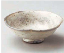
イ064-169 粉引櫛目反小鉢 φ13×4.8cm (陶) JPN 2,500円