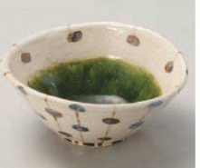
ネ064-089 手描きすだれ織部たわみ小鉢 13.5×12.3×5.8cm (陶) JPN 3,300円