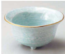
ミ064-269 鳴海青地三ツ足小鉢 φ11.8×5.9cm (磁) JPN 3,650円