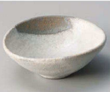
×064-179 灰釉粉引3.3楕円小鉢 10×9×4cm JPN 2,900円