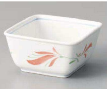
ミ064-279 舞華(強化磁器)4.0角小鉢 9.7×9.7×5.1cm (強) JPN 2,500円