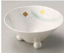
ミ064-119 強化金箔ヒワ吹きラスター三ツ足小鉢 11.5×5.2cm (強) JPN 3,850円