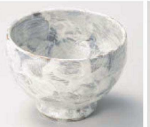
コ064-199 白刷毛タタキ 高台小鉢 φ10×7.3cm (280cc) (陶) JPN 3,000円