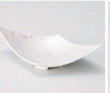
ミ064-149 ピンク-珍ラスター-菱形画上り鉢 21.2×12×5.5cm (磁) JPN 3,650円