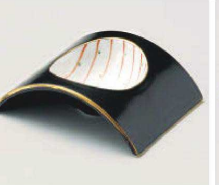
ミ064-099 黒マット朱十草アーチ型小付 12.8×10×3cm (磁) JPN 3,400円