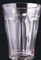
又645-089 EZ310ml カットタンブラー クリア φ8.3×11.3cm (310cc) JPN 900円