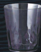
又645-069 EZ280ml クリスタルタンブラー スモーク φ8×9cm (280cc) JPN 750円