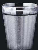
又645-159 EZ360ml スタックタンブラー スモーク φ8.3×10.5cm (360cc) JPN 500円