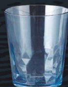
又645-059 EZ280ml クリスタルタンブラー ブルー φ8×9cm (280cc) JPN 750円