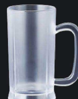
又645-179 EZ300ml ビアジョッキ クリア φ7×13.2cm (300cc) JPN 1,600円