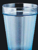
又645-149 EZ360ml スタックタンブラー ブルー φ8.3×10.5cm (360cc) JPN 500円