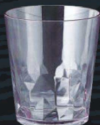
又645-049 EZ280ml クリスタルタンブラー クリア φ8×9cm (280cc) JPN 700円