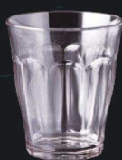
又645-079 EZ280ml カットタンブラー クリア φ8.3×9.5cm (280cc) JPN 750円