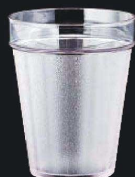
又645-139 EZ360ml スタックタンブラー クリア φ8.3×10.5cm (360cc) JPN 450円