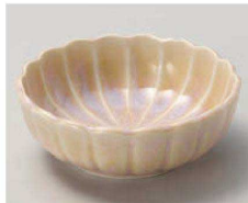
タ068-169 菊華トンスイ(桃) φ12.5×4.5cm (磁) JPN 1,700円