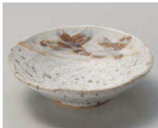
コ068-129 石垣志野平小鉢 φ13.8×4.2cm (陶) JPN 1,740円