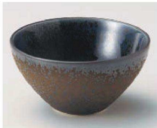
ア068-079 グーダンボール小 φ11.8×6.4cm (陶) JPN 1,750円