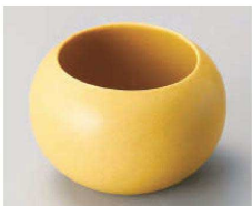
ハ068-039 テラコッタまんまるカップ φ6.3×6.5cm (230cc) (磁) JPN 1,900円