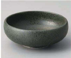
ハ068-299 黒水晶括り手小鉢 φ11×4cm (磁) JPN 1,500円