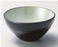
ア068-089 グリーン 12cm ブラックボウル φ12×6.3cm (磁) JPN 1,750円