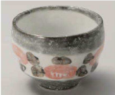
ア068-259 おび山茶花 赤たつぷり碗 φ10×7.5cm (磁) JPN 1,800円