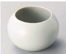
ハ068-049 クールグレーまんまるカップ φ6.3×6.5cm (230cc) (磁) JPN 1,900円