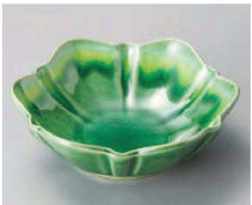
オ068-219 グリーン流し花型小鉢 11.8×11×4cm (磁) JPN 1,780円