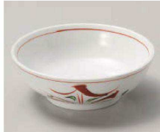
カ068-229 手描き京小花玉割(小) φ11.5×4cm (磁) JPN 1,700円