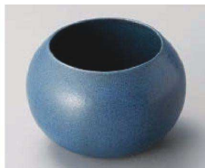
ハ068-019 ネイビーまんまるカップ φ6.3×6.5cm (230cc) (磁) JPN 1,900円