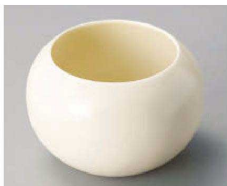
ハ068-029 パニラマットまんまるカップ φ6.3×6.5cm (230cc) (磁) JPN 1,900円