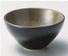
ア068-099 カーボン 12cm ブラックボウル φ12×6.3cm (磁) JPN 1,750円