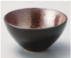
ア068-109 レッド 12cm ブラックボウル φ12×6.3cm (磁) JPN 1,750円