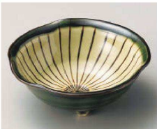
コ068-149 織部櫛目三ツ足小鉢 φ13×5cm (陶) JPN 2,000円