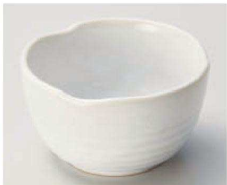
ト068-189 白雪三ツ山4.0鉢 φ12×6.8cm (磁) JPN 1,700円 ト068-199 白雪三ツ山3.6鉢 φ10.5×6cm (磁) JPN 1,300円