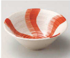
コ068-239 うるし流水(赤)4.0鉢 φ12×4.5cm (陶) JPN 1,800円