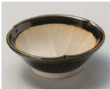
ト068-139 織部三ツ押小鉢 φ12×4.8cm (陶) JPN 1,750円