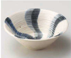
コ068-249 うるし流水(青)4.0鉢 φ12×4.5cm (陶) JPN 1,800円