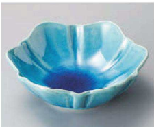
オ068-209 トルコ釉花型小鉢 11.8×11×4cm (磁) JPN 1,780円