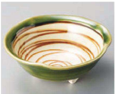
コ068-159 織部うず三ツ足小鉢 φ13×5cm JPN 2,000円