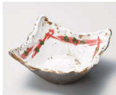
ア068-119 染付赤刷毛粉引南蛮13.5cm角鉢 13.5×13×6.2cm (磁) JPN 2,000円