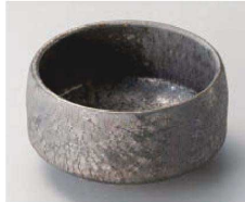
ハ068-279 金結晶抹茶小鉢 φ9×4.8cm (磁) JPN 2,000円