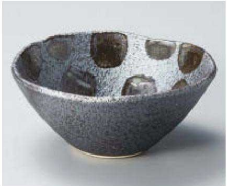
コ068-319 黒市松盛り鉢(小) φ12.6×5.4cm (磁) JPN 1,650円