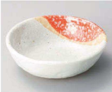
コ068-309 なごみ4.0ボール φ13×4.2cm (磁) JPN 1,680円