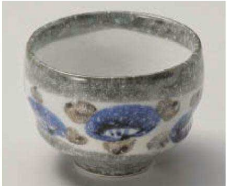
ア068-269 おび山茶花 青たつぷり碗 φ10×7.5cm (磁) JPN 1,800円