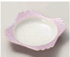
ミ068-059 紫白吹 四つ重ね 小鉢 13.5×13.5×3.3cm (磁) JPN 1,800円