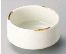
ハ068-289 瀬鑄ヒツ貫入抹茶小鉢 φ9×4.8cm (磁) JPN 2,000円