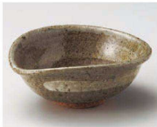
ト068-179 唐津刷毛目片口小鉢(小) 13×12×5cm (陶) JPN 1,700円