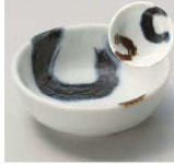
夕084-109 濃刷毛砂目3.0小付 φ9.2×3.3cm (陶) JPN 1,200円