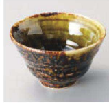
夕084-099 天の川3.0小付 φ9.5×5.7cm (陶) JPN 1,200円