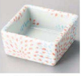
オ084-229 夏夜空花火角小付 6.1×6.1×2.9cm (陶) JPN 1,100円