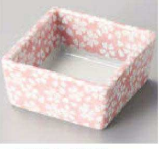
オ084-219 風華角小付 6.1×6.1×2.9cm (陶) JPN 1,100円