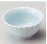
N084-079 青白磁菊型小鉢(大) φ10.3×5.2cm (陶) JPN 1,200円 N084-089 青白磁菊型小鉢(小) φ9×4.5cm (陶) JPN 1,000円