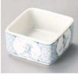
ネ084-129 染付鳥獣戯画角小付 6.3×6.3×3.5cm (陶) JPN 1,100円