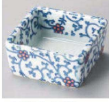
オ084-189 実結美角小付 6.1×6.1×2.9cm (陶) JPN 1,100円