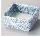
オ084-169 ベイズリー角小付 6.1×6.1×2.9cm (陶) JPN 1,100円