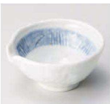
カ084-059 ゴス刷毛片口小付 9.4×9×4.3cm (陶) JPN 1,200円