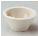
ミ084-029 粉引オレンジ吹片口小付 φ9.3×4.6cm (陶) JPN 1,250円