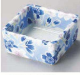
オ084-199 桜藍染角小付 6.1×6.1×2.9cm (陶) JPN 1,100円