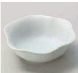
□084-049 青花 花型小付 φ9.6×3.3cm (陶) JPN 1,240円