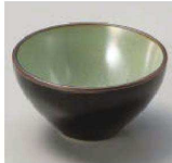
ア084-459 ブラックボール グリーン φ8×4.5cm (陶) JPN 1,100円