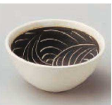
ホ084-069 かきおとし小付 φ8.6×4.3cm (陶) JPN 1,280円