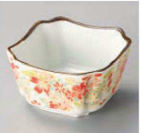
オ084-509 焔友禅角小鉢 8×8×4.5cm (陶) JPN 1,000円

表示価格、仕様などは予告なく変更となる場合があります。最新情報はWEBサイトにて必ずご確認下さい(廃番合)。