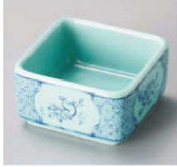
ネ084-119 窯変空色鳥獣戯画角小付 6.3×6.3×3.5cm (陶) JPN 1,100円