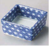
オ084-149 青藍七宝小付 6.1×6.1×2.9cm (陶) JPN 1,100円