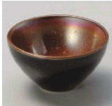
ア084-469 ブラックボール レッド φ8×4.5cm (陶) JPN 1,100円