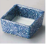
オ084-159 夕コ唐草角小付 6.1×6.1×2.9cm (陶) JPN 1,100円