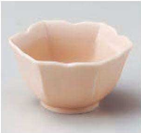
ホ084-489 ピンク六角小付 φ8.5×4.5cm (陶) JPN 1,100円