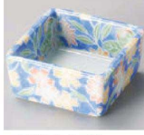
オ084-179 満開夜空角小付 6.1×6.1×2.9cm (陶) JPN 1,100円