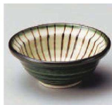
□084-019 織部御目小付 φ9.4×4.4cm (陶) JPN 1,320円