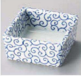
オ084-139 江戸唐草小付 6.1×6.1×2.9cm (陶) JPN 1,100円