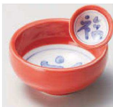
ツ084-039 柿福丸珍味 φ8.8×4.3cm (陶) JPN 1,250円