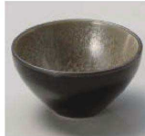
ア084-449 ブラックボール カーボン φ8×4.5cm (陶) JPN 1,100円