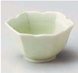
ホ084-479 ヒワ六角小付 φ8.5×4.5cm (陶) JPN 1,100円