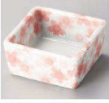
オ084-209 薄紅桜角小付 6.1×6.1×2.9cm (陶) JPN 1,100円