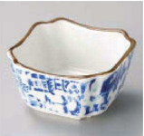
オ084-499 昇龍紋角小鉢 8×8×4.5cm (陶) JPN 1,000円