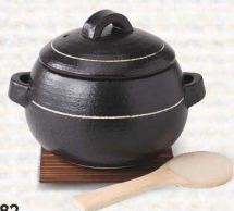
5113-1-82 ラインブラック ごはん鍋 3合炊セット ¥8,000 (税込¥8,800)

・品: ごはん鍋×1/φ18×16cm、しゃもじ×1/6.3×20cm、 敷板×1/15×15×0.8cm 12入 ・ごはん鍋: 耐熱陶器、しゃもじ: 竹、敷板: 杉板 ・箱: 22×22×17cm ポール箱 ・重量: 1950g 万古焼・付属品: しゃもじ×1、敷板×1