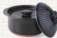
5113-2-81 菊花ルリ 炊飯鍋 (2合炊) ¥8,000 (税込¥8,800)

火加減いらず、手間いらずで約30分。 かまどで炊いたような美味しい ごはんが炊けます。